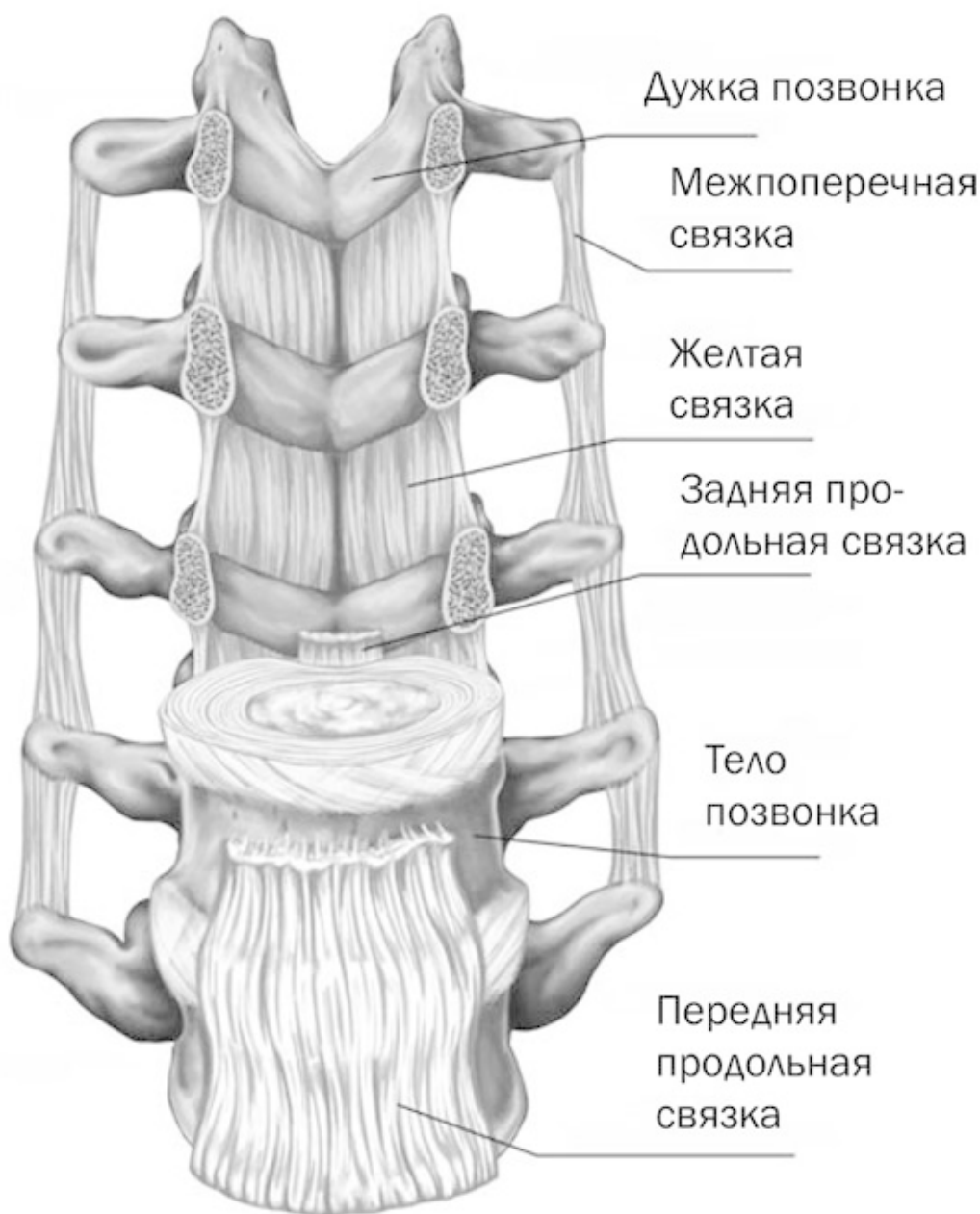
Позвонки и связки

Между собой позвонки не только скрепляются связками, но и разделяются межпозвонковыми дисками, которые находятся между телами позвонков. Состоят диски из двух частей. Первая – периферическое кольцо, которое приращено к верхнему и нижнему позвонкам. Кольцо держит позвонки близко друг к другу, не дает им смещаться. И вторая часть – центральное (пульпозное) ядро, находящееся в центре кольца и являющееся амортизатором между позвонками. Именно за счет ядер дисков и физиологических изгибов осуществляется амортизационная функция позвоночника.