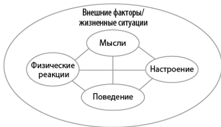
Рис. 2.1. Пятичастная модель определения жизненного опыта. © 1986 by Christine A. Padesky

В ходе второго визита психотерапевт помог Бену осознать изменения, которые произошли в его жизни за последние два года. С помощью пятичастной модели, представленной на рис. 2.1, Бен смог увидеть, как череда внешних изменений или ключевых событий жизни (рак Сильвии, смерть Луи) привели к изменению поведения (прекращение регулярных встреч с друзьями, дополнительные визиты в госпиталь для лечения болезни жены). Кроме того, его представление о себе и своей жизни изменилось («Все дорогие мне люди умирают», «Я больше не нужен моим детям и внукам»), его эмоциональное (раздражение, грусть) и физическое (усталость, проблемы со сном) состояние ухудшилось.