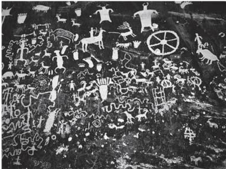
Газетная скала, штат Юта (фрагмент)