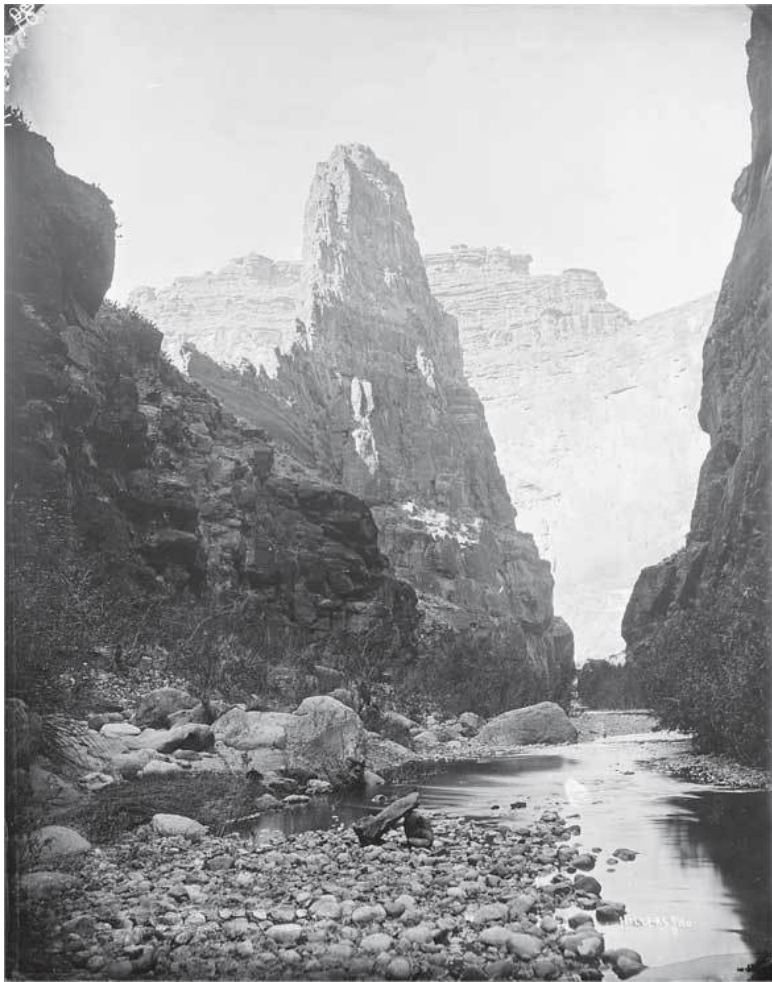
Из архивов Нолана Мура. Мраморный каньон. Старая фотография (дата съемки неизвестна)