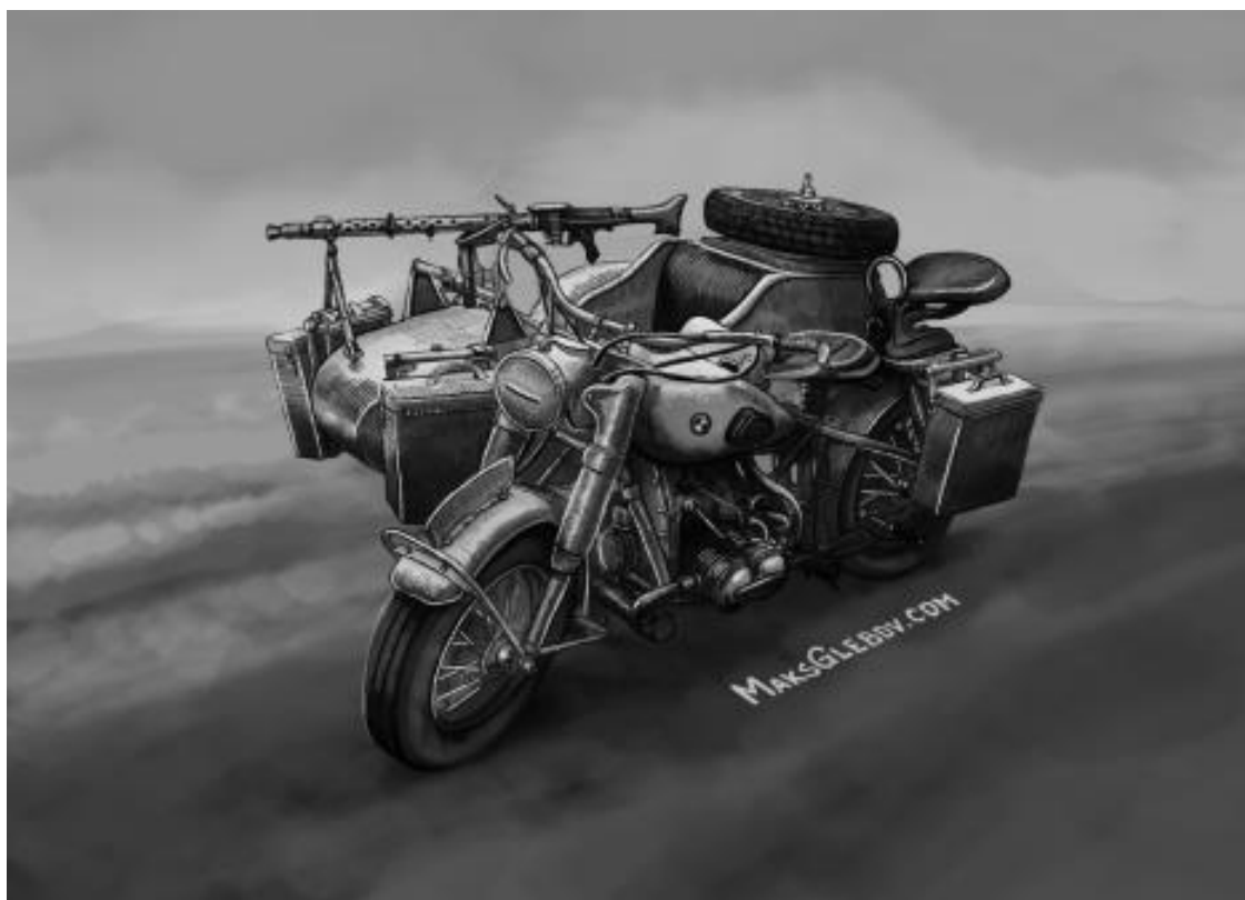
Мотоцикл BMW, с пулеметом MG-34 на боковом прицепе. Различные модели подобных мотоциклов широко использовались вермахтом в ходе второй мировой войны.