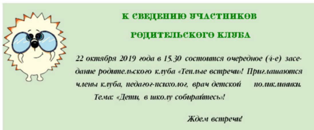
Листовка-объявление о заседании клуба на сайте психолога