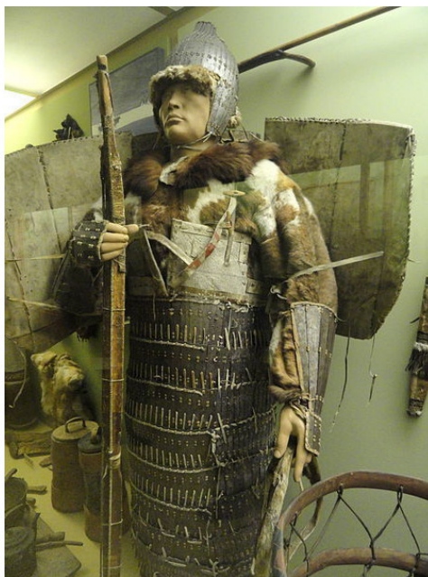
Воинские доспехи и сухожильный лук чукчи, XIX век. Экспонат Американского музея естественной истории, Манхэттен, Нью-Йорк, США

Чукчи не имели какого-либо устоявшегося, четкого управления. Как и в первобытные времена, каждое стойбище, то есть, каждая родовая община, жило своей жизнью по своим неписанным правилам, отношения с другими стойбищами и другими этносами выстраивало по своему усмотрению. Даже семейные порядки чукчей (как, впрочем, и у других народов тундры) отличались значительным либерализмом; решающие методы наказания детей, нарушавших дисциплину и субординацию перед старшими, сводились к рассказыванию страшных сказок о бедах, которые грозят непослушной и непочтительной молодежи. Основным авторите-