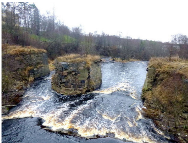
Вот что сегодня осталось от дамбы и старого моста

В деревне два старых погоста, на одном хоронили православных, а на другом старообрядцев. Оба расположены на высоком берегу реки рядом с мостом-плотиной. Ежегодно в Троицу помянуть ближних собираются на них сотни людей. Однажды Троица выдалась жаркой. Это обстоятельство не отменило советскую традицию крепко выпивать на могилах родственников. После поминок многие пожелаали освежиться в реке. К несчастью одному человеку выплыть не удалось. Как часто бывало в советские времена, реакция власти на это событие оказалась самой бестолковой. Секретарь райкома приказал демонтировать шлюзы и спустить воду. С этого действия человек начал уничтожать ту уникальную природу, которая естественно сформировалась в речке Мге и вокруг нее. Уже через два-три года после этого на всем протяжении реки Мги ее берега стали отдавать в собственность дачникам, совсем не учитывая национальную особенность нас, русских, гадить под себя. Речка оказалась слишком маленькой, чтобы выдержать такой объем грязи, сливаемой в нее.