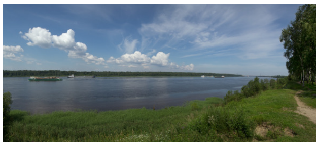
Нева у Кировска

Молодыми, даже уже, будучи студентами, мы долго страдали от недостатка здравого смысла. Зимой обычно ездили на выходные в Кировск электричкой, которая от станции Кушелевка шла на Невскую Дубровку, это был самый короткий путь из Питера. Проблема в том, что надо было переходить Неву, но нам молодым и спортивным все было нипочем. Однажды поехали уже весной, именно двенадцатого апреля. Вышли к Неве. Лед стоит, но почти на всей его поверхности вода, а мы, нас четверо, в туфлях. Решили перебежать, а туфли с носками высушить дома. План удался. На следующий день, гуляя по городу на весеннем солнышке, вышли к Неве. Довольно долго стояли молча, наблюдая ледоход. Видно все думали об одном и том же, представляя себя среди этих льдин.