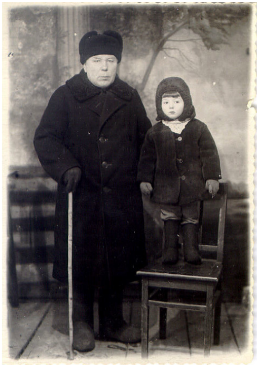
Конец 1952. С дедом. Мне два года