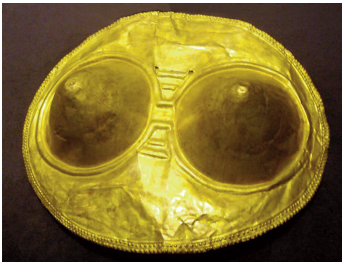
Пектораль из тумбаги (культура Кимбая)

Человек, который раньше делал ботинки для себя и своей семьи, понимает, что он умеет делать хорошие ботинки, а другие люди плохо обуты, и тогда он решает открыть обувную мастерскую. У этого человека появляется технологический менталитет, потому что для работы в обувной мастерской, кроме работников, нужно использовать еще целый ряд инструментов и приспособлений, которыми его обеспечит кузнец. А кузнецу, чтобы выплавлять гвозди и молотки, необходимы наковальни, кузнечные меха и устройства, которые дадут ему возможность, используя механику, делать не один молот или одну мотыгу для себя и своей семьи, а сотни мотыг, кос, ножей... Так рождается человек технологический, человек, который будет использовать машину практически на пределе ее возможностей.