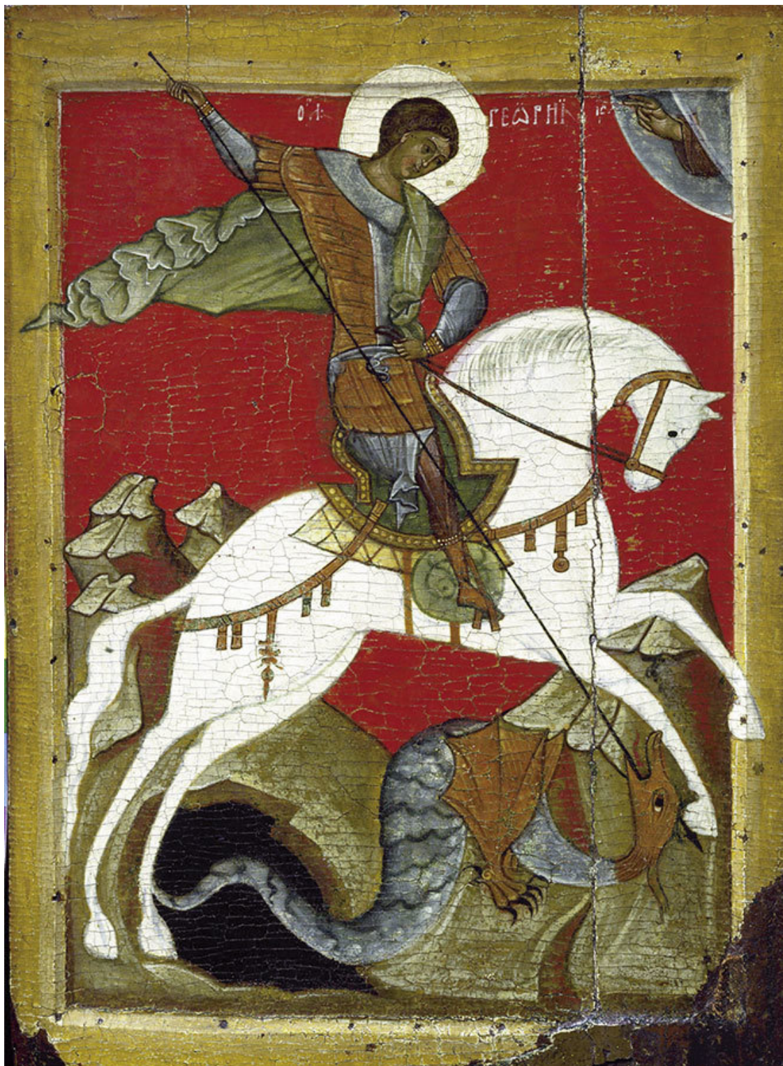
«Чудо Георгия о змие». Новгородская икона, XIV в. Государственный Русский музей

Древний миф о Святом Георгии и драконе нужно возродить в нас самих. Мы должны обладать мужеством и силой, чтобы сжать в руках копьё правды, естественной реальности и вонзить его в самое сердце материализма и инерции.