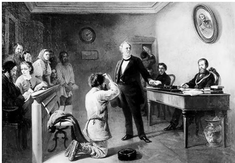
А. Волков. Сцена в суде

Иерей – священнослужитель второй ступени в христианской церковной иерархии, женатый священник, к которому обращались ваше преподобие .