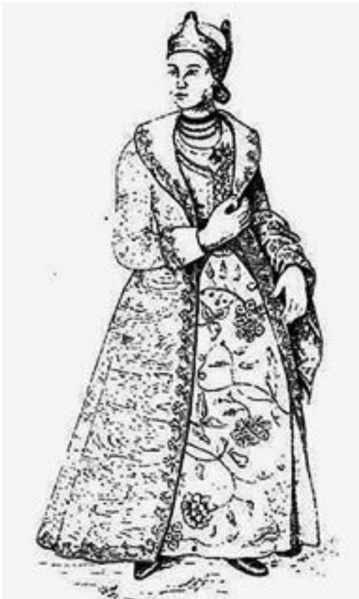
А. Ригельман. Украинская дворянка в кораблике на голове. XVIII век

«...с корабликом на голове...» Кораблик – традиционный головной убор замужних женщин