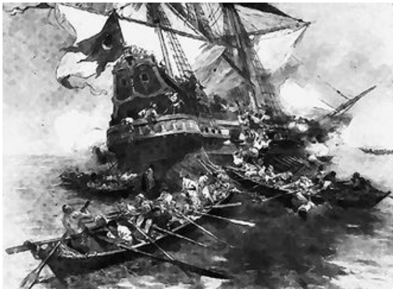
Н. Самокиш. Абордаж турецкого корабля казаками

золота». Сведения о захватнических походах казаков, о набегах на населенные пункты и торговые караваны, о наемной службе зафиксированы с начала XVI века. В XVII веке походы казаков в Османскую империю и войны с турками стали обычным явлением, к тому же довольно прибыльным. Например, в 1616 году 2 000 казаков во главе с Петром Сагайдачным разгромили в устье Днепра турецкую флотилию, захватили десятки галер и сотню лодок. Затем они напали на Кафу – рынок рабов в Крыму, ограбили местное турецкое и татарское население, попутно освободив из неволи тысячи рабов.