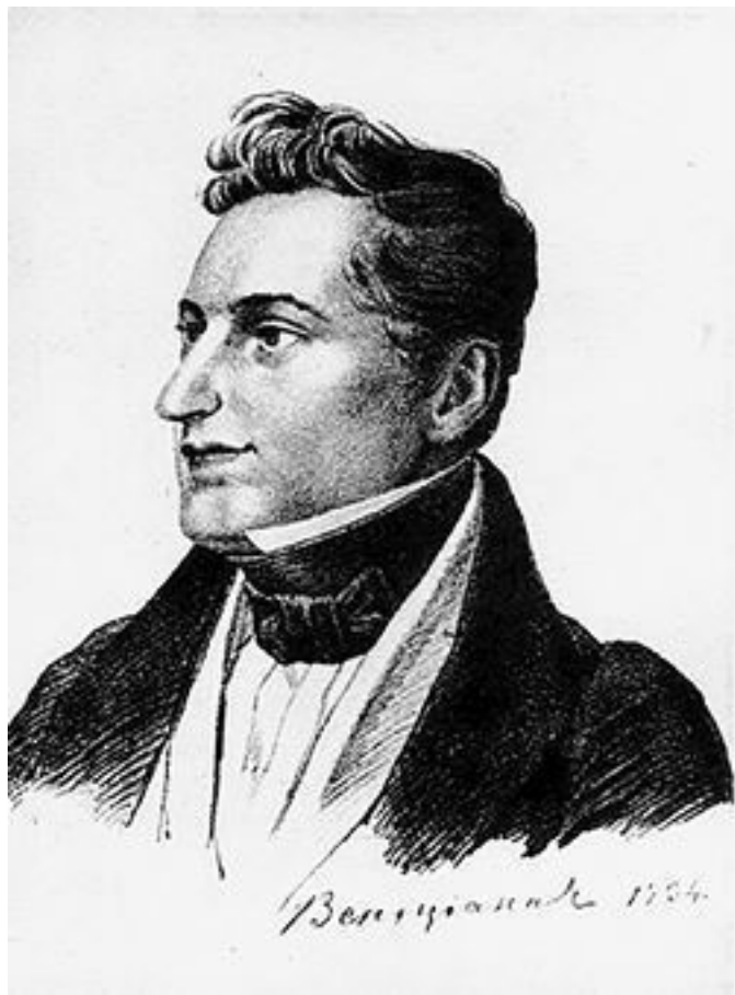
А. Венецианов. Гоголь в 1834 году

Если интерес Гоголя к страшным сюжетам подогревался