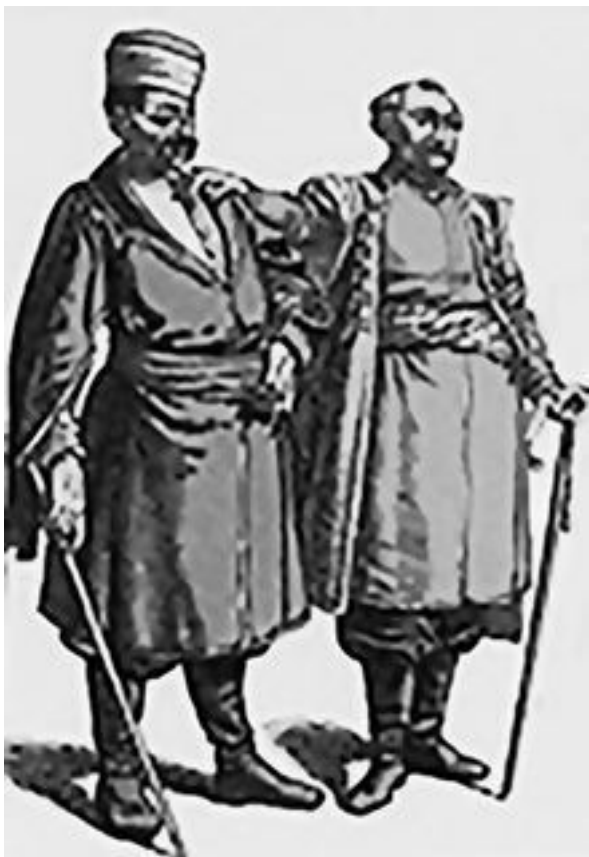
Польские дворяне в жупанах. XVII век