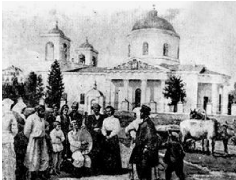
Гадяч. Успенский собор