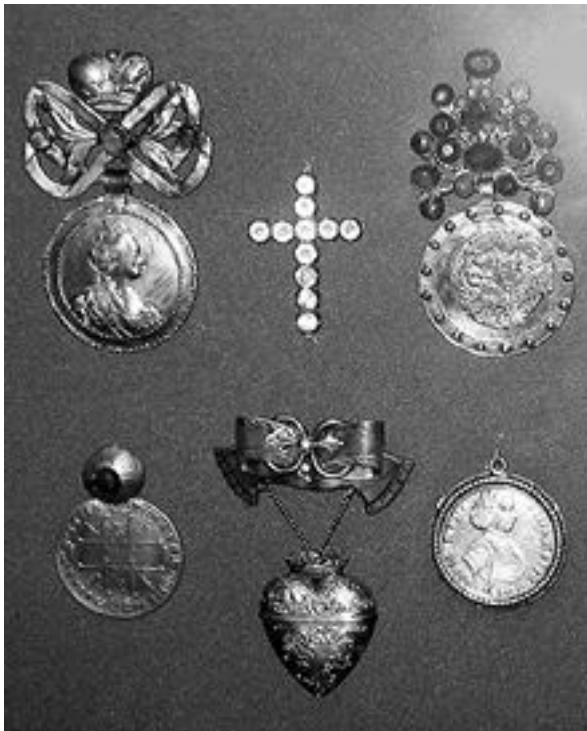
Дукаты. XVIII–XIX века

«...медные кресты и дукаты». Дукат (устар.) – женское украшение в виде монеты.