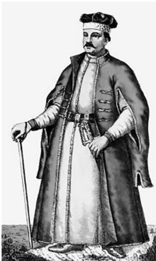
Украинский шляхтич в кунтуше