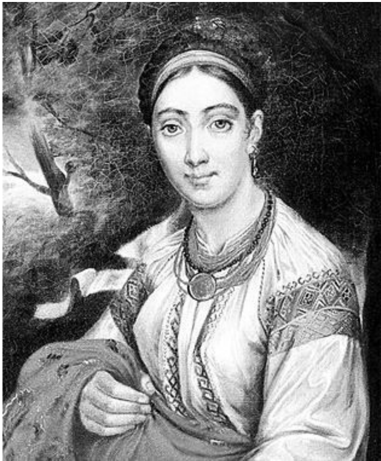
В. Тропинин. Девушка-украинка в пейзаже

В селе была церковь, чуть ли еще, как вспомню, не свято-