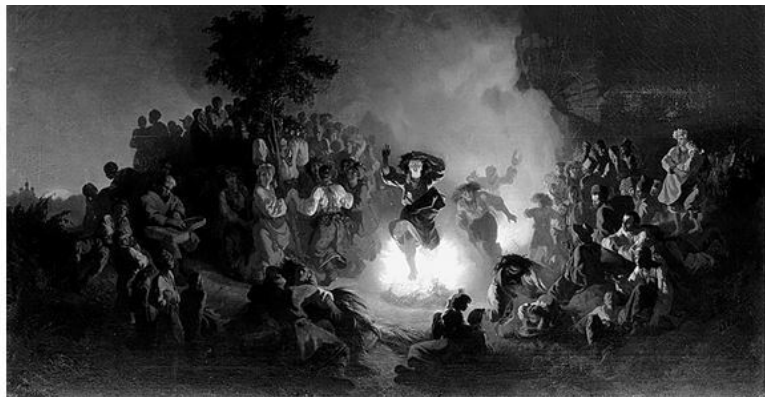
И. Соколов. Ночь на Ивана Купала

Иоанна Предтечи. Ночь накануне праздника по важности ритуалов и обрядов, связанных с водой, огнем и травами, превосходит сам праздничный день. В ночь на Ивана Купала принято было совершать брачные обряды, выбирая будущего суженого: прыгать через костер, обмениваться венками, искать цветок папоротника, купаться в утренней росе.