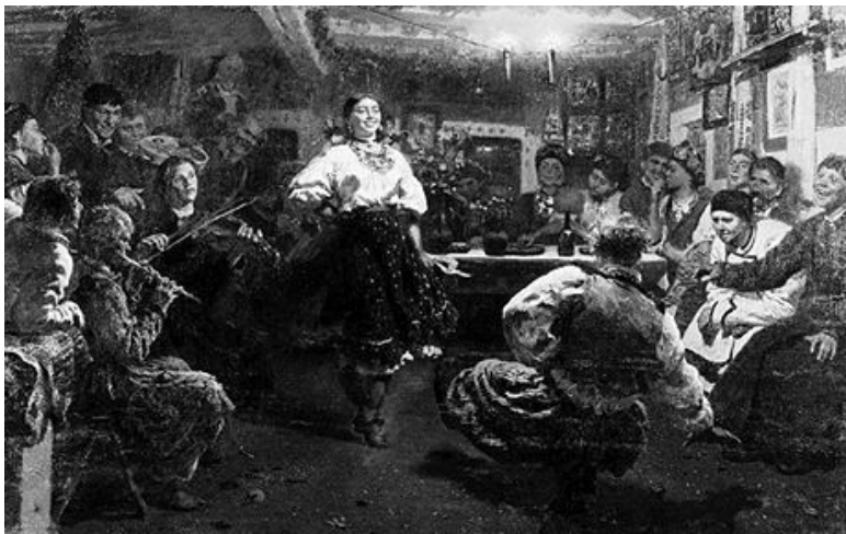
И. Репин. Вечерницы

вечерницы поздней осенью и продолжались до Великого поста, делились на будние и праздничные, на которых только развлекались.