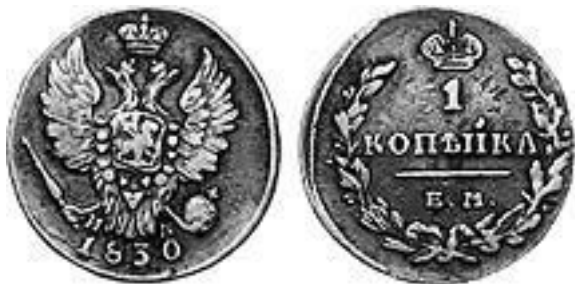
1 копейка. 1830 год

«...нет совести, видно, и на полшеляга». Шеляг – в XIX веке народное название российской копейки в Украине. Более крупная денежная единица называлась копой (кипником). Одна копа равнялась 50 шелягам (копейкам).