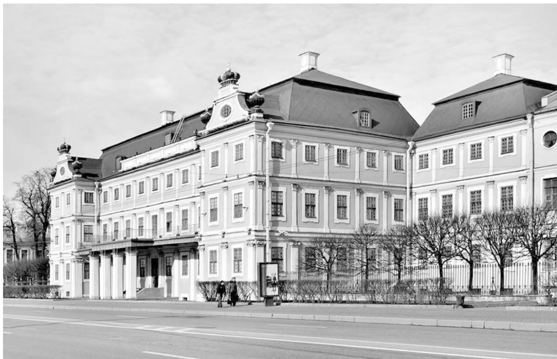
Дворец А.Д. Меншикова. Современное фото

Дворец Меншикова также поражал своей роскошью: золото, серебро, мрамор, дорогие сорта дерева, античные и итальянские скульптуры, венецианские зеркала, хрустальные люстры, гобелены и шелковые китайские обои. Часть этих интерьеров сохранилась до наших дней и любой может убедиться, что Меншиков умел жить с размахом.