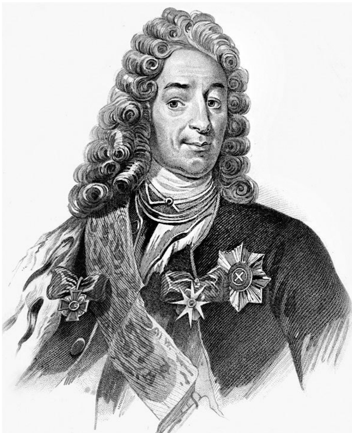
А. Д. Меншиков

Вторая история также о том, как Петр рассердился на Меншикова, и что из этого вышло: «Петр Великий, однажды разгневавшись сильно на князя Меншикова, вспомнил ему, какого он происхождения, и сказал при том: „Знаешь ли ты, что я разом поверочу тебя в прежнее состояние, чем ты был. Тотчас возьми кузов свой с пирогами, скитайся по лагерю и по улицам и кричи: пироги подовые! Как дельвал прежде. Вон! Ты не достоин милости моей“. Потом вытолкнул его из комнаты. Меншиков кинулся прямо к императрице, которая при всех таких случаях покровительствовала, и просил со слезами, чтоб она государя умилоствовала и смягчила. Императрица пошла немедленно, нашла монарха пасмурным. А как она нрав супруга своего знала совершенно, то и старалась, во-первых, его всячески развеселить. Миновался гнев, явилось милосердие, а Меншиков, чтоб доказать повинование, между тем, подхватя на улице у