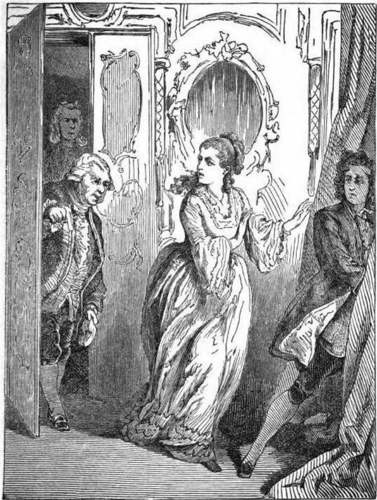
Der Pavillon von Andrée.