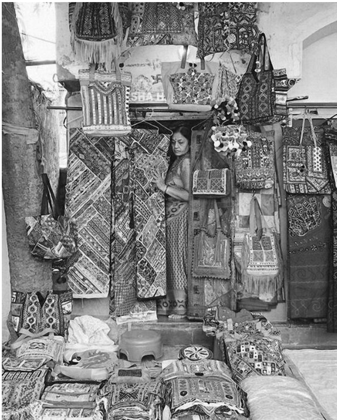
Сари и просто хорошая женщина там

После этого мокрого вечера я двинулся в Мумбаи (бывший Бомбей) – легендарный мистический мегаполис, где разворачивалось яркое действие романа «Шантарам». И провел на ногах несколько суток, безуспешно пытаясь обойти пешком этот самый Мумбай. Особенно запомнилось купание в Индийском океане – он оказался абсолютно черным, как выяснилось, очистных сооружений здесь не существует, и всё дерьмо мегаполиса попадает в прибрежные воды! Там я нашел статуэтку Афродиты с оторванной головой.