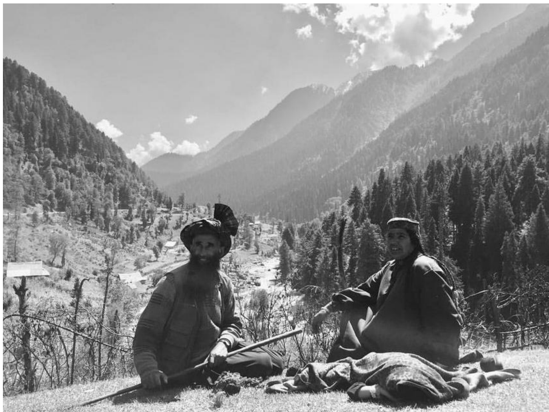
Хабиб с женой в горах Памира – кайф!