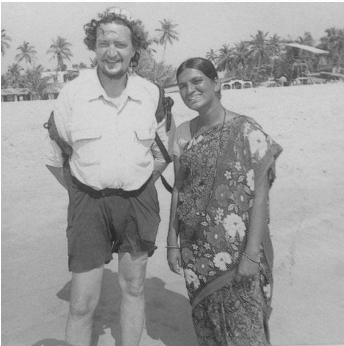
С индианкой на ГОА – t° там под 50...