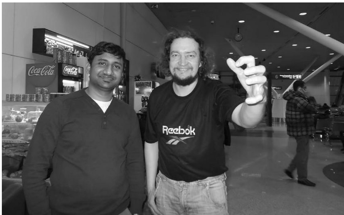
Первый индус был приличный и улыбался

Описывать индийские поезда можно долго. Скажу просто – ничего страшного. Шок лишь первые двое суток, а потом ты просто в трансе от того, как на полку по три-пять-семь человек влезает... Но самое удивительное – все держатся с запредельным достоинством и притом не хамят мимоходом.