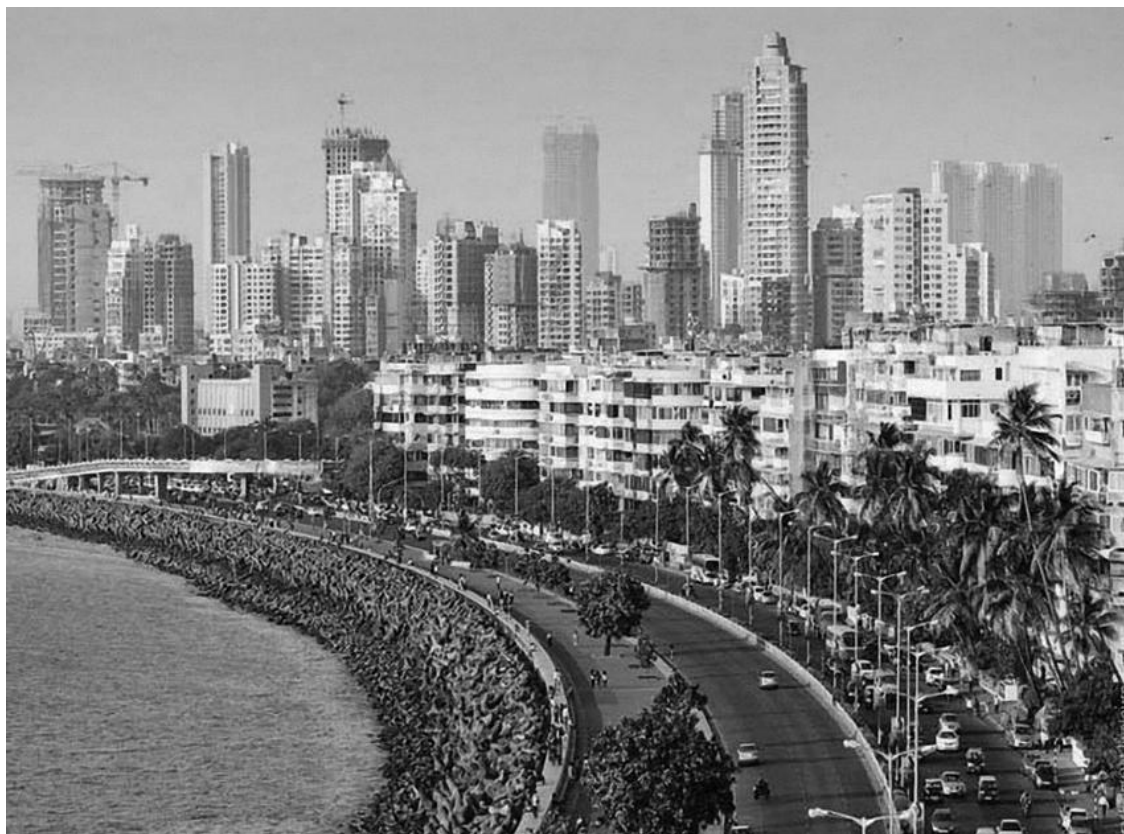
Самый центр Бомбея – Морен-Драйв

С трудом пролезая в рваную сетку у фазенд, я вышел к морю, где весь берег был в мусоре, а само море почему-то было черного мазутного цвета. Как потом выяснилось, такой колор получается от слияния соленой морской воды и фекалий – но тогда я не знал этого и вдоволь понежился среди мутных вод... не Ганга, нет, но моря... черного! И вдруг среди грязи и отбросов я увидел ее – Афродиту, маленькую безголовую женщину, робко прижавшую кувшин к девичьей груди! Я бережно взял ее в руки и отмыл, долго-долго выплескивая жижу из полых каменной статуэтки. Наконец она была чиста!