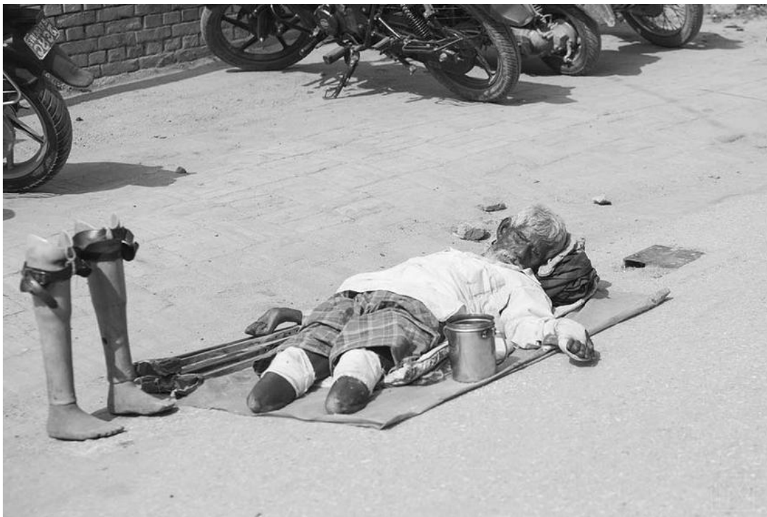
Отдых в Индии святое! Никто не тронет

Всё вроде бы встает на места. У всех людей есть проблемы, ты-то видишь, но не все отваживаются сесть в круг, заняться чем-то непривычным, выбивающимся из череды обыкновенных вещей – мантры, размышления, радость общения, ненавязчивая, как на работе, и не такая мимолетная, как в быту... Круг размыкается – и ты чувствуешь бриз вечности, ты понимаешь, что все души тянутся друг к другу.