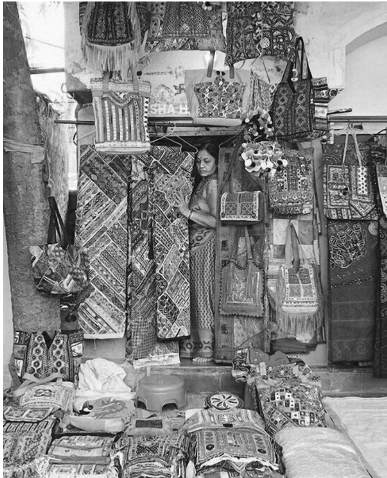
Сари и просто хорошая женщина там