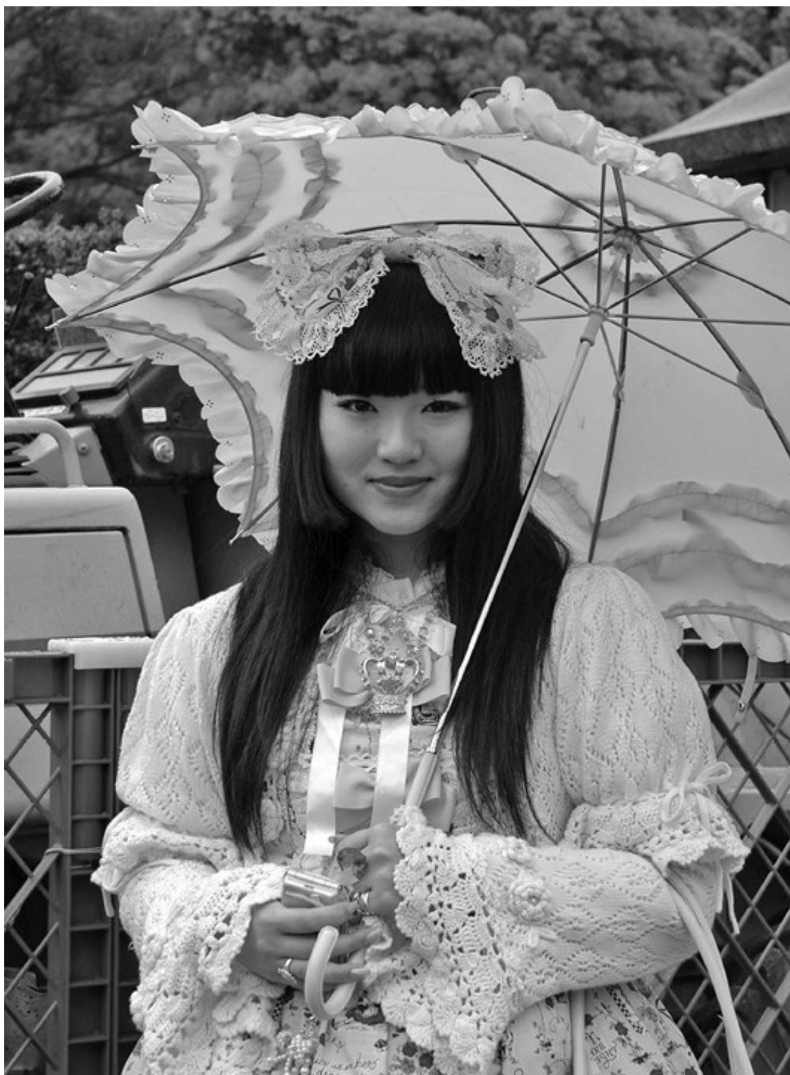
Японская городская субкультура: девушка-подросток в образе Лолиты. Фотограф Джей Бергсен. Фотография публикуется по лицензии Creative Commons