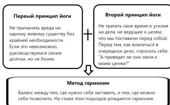
Рис.1. Принципы йоги и метод гармонии.

Йога – это система самопознания, придерживающаяся принципов доброты и здравого смысла и ведущая человека к свободе. Основным методом этой системы является принцип гармонии, или того, где нужно себя заставить, а где можно себе позволить, или как испытывать счастье и радость от того, что мы заставляем себя или от того, что мы позволяем себе.