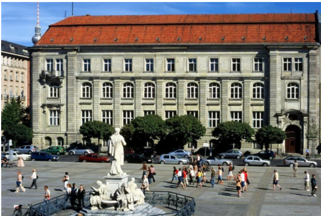
Берлинская Академия наук

Берлин являлся столицей Пруссии, а после – Германской империи. Поэтому совершенно естественно, что он стал научным центром страны. Конечно, после 1945-го года для Западного Берлина все оказалось несколько иначе. А что касается Восточного Берлина, после создания ГДР и объявления Берлина его столицей положение восстановилось – было обеспечено восстановление практически всех научных учреждений и Германской академии наук в Берлине, действительными членами которой продолжали оставаться ученые с запада. Также было 4 солидных университета: Берлинский университет искусств (запад), Берлинский технический университет (запад), Берлинский университет им. Гумбольдта (восток), Свободный университет Берлина (запад).