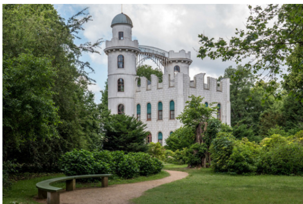
Дворец Пфауэнинзель.

А еще в Берлине можно наблюдать большое количество мостов, огульную толерантность, немалый удельный вес в искусстве направления авангардизма, оживленность ночной жизни.