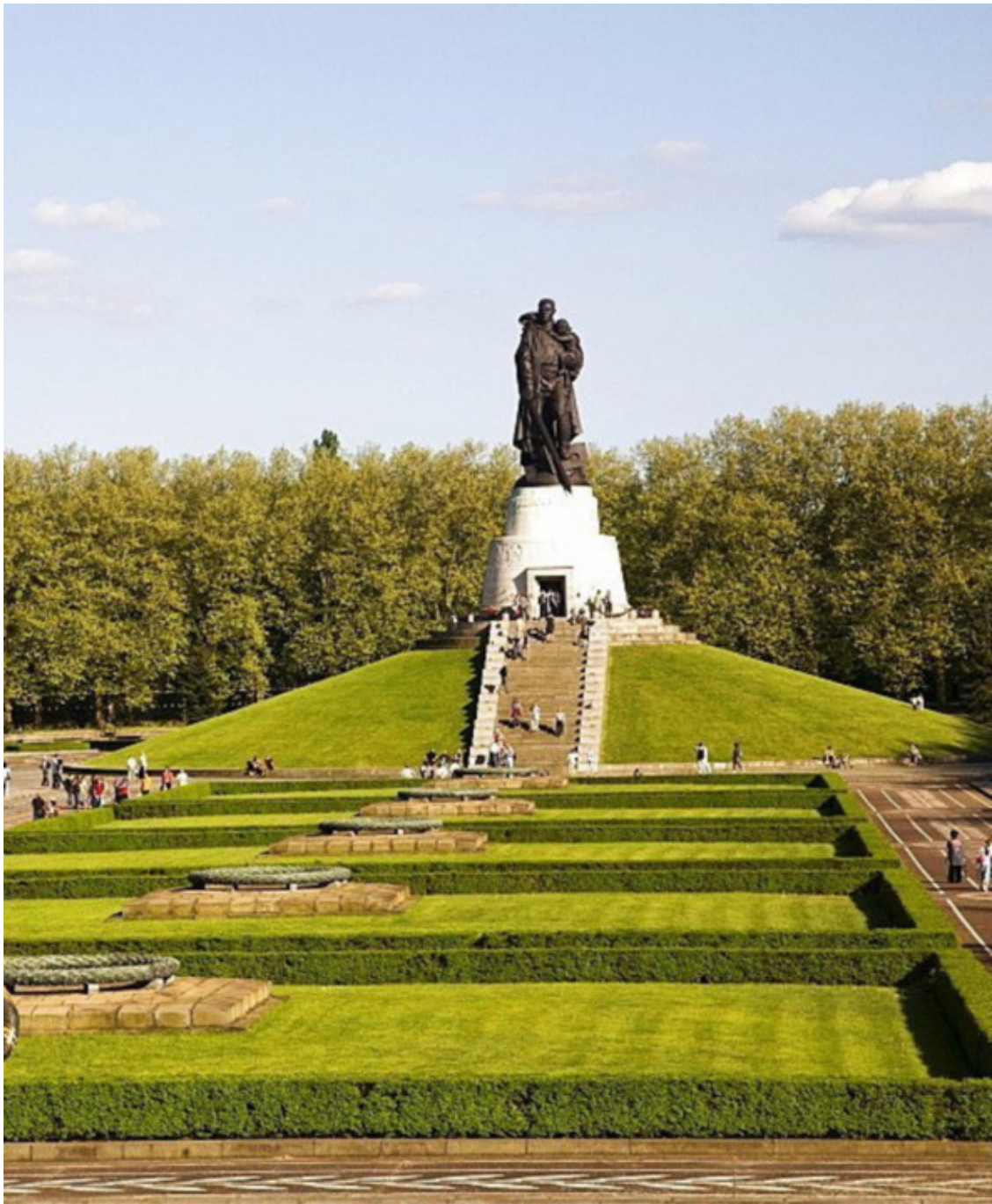
В Трептов-парке.

В Трептов-парке (восточная часть города) было обеспечено открытие памятника-кладбища советским воинам, которые пали во время сражений за Берлин, с мавзолеем. На мавзолее поместили статую Воина-освободителя (скульптором выступил Вучетич Е. В.).