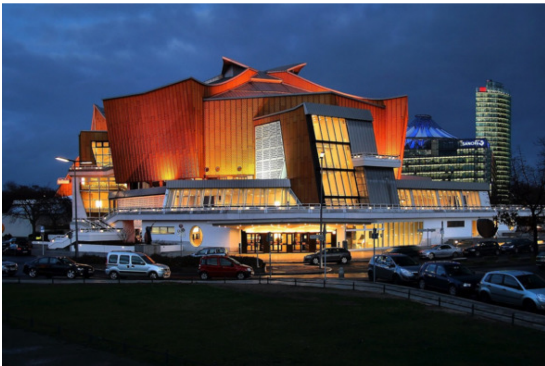
Берлинская Филармония. От Антона Долина. Источник: https://nat-geo.ru/travel/europe/putevoditel-po-berlinu-ot-antona-dolina/

«квартал Ганза, построенный интернациональным коллективом архитекторов, жилой квартал у Олимпийского стадиона (архитектор Ле Корбюзье), Карл-Маркс-аллее, Дом радиовещания, Госсовет, Конгрессхалле (архитектор Х. Стаббинс), Дворец республики в восточной части города, промышленная выставка „Интербау“, Берлинская филармония, Новая национальная галерея (1968; архитектор Л. Мис ван дер Роэ)».