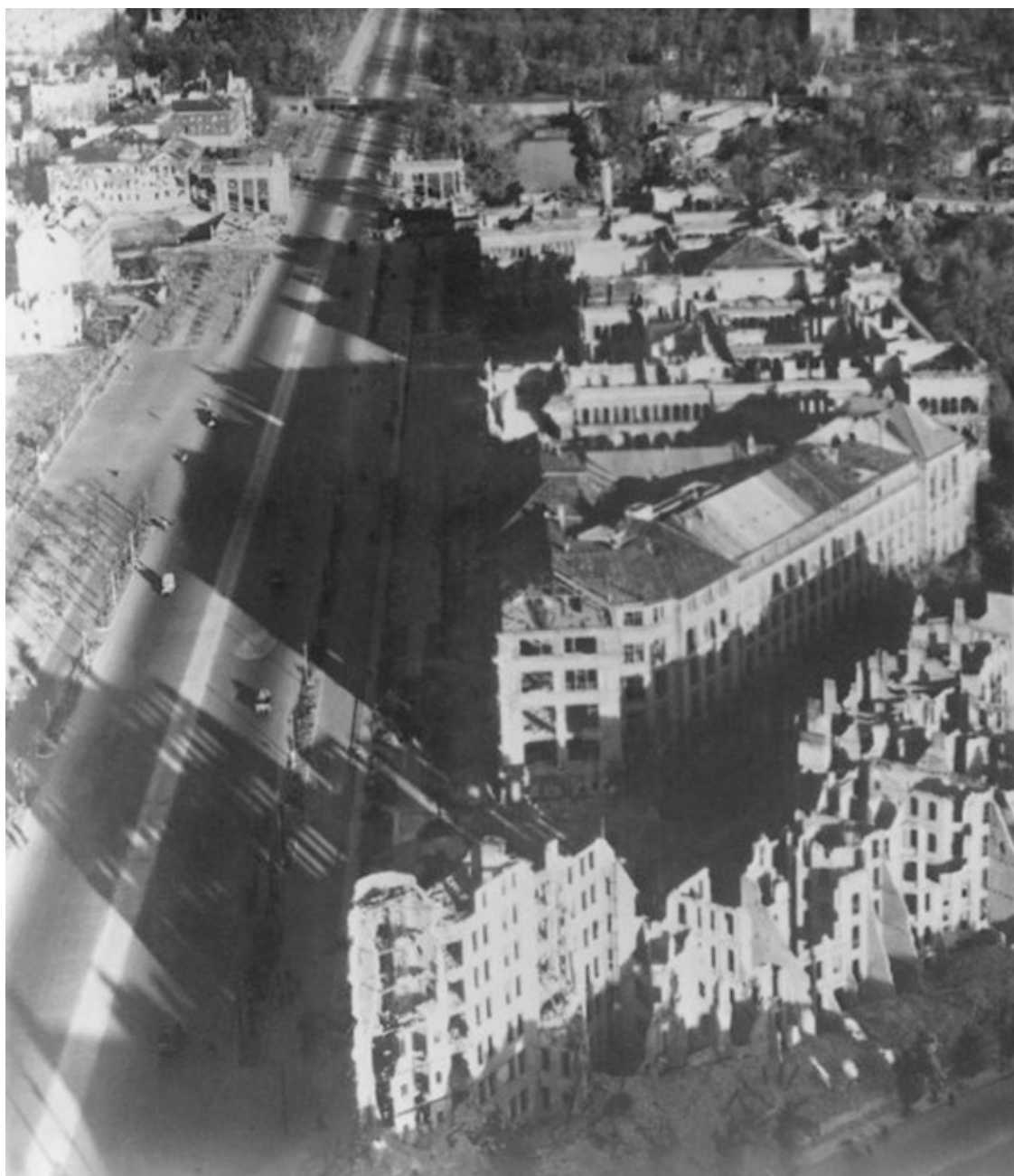
«Технический колледж сразу после войны. Год спустя он вновь открылся как Технологический университет».