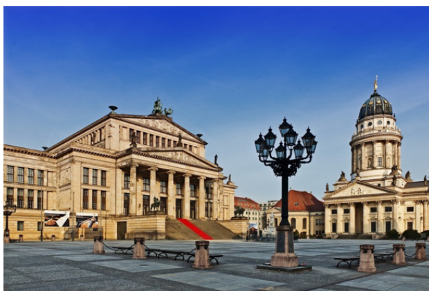
Берлин. Историческая часть города

Берлин находится на на Европейской равнине, он из-за этого подвержен влиянию умеренного сезонного климата. Примерно 3-я часть его территории – это озера, каналы, реки, сады, леса и парки.