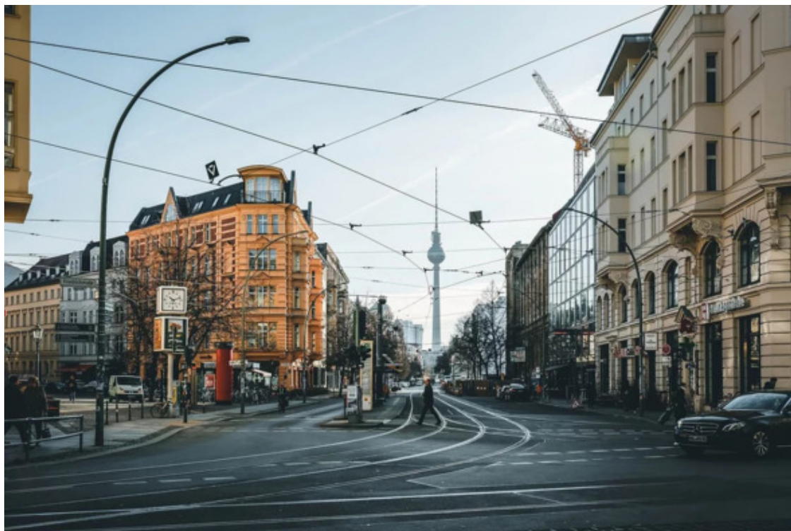
Берлин. Центр Города

Город находится в восточной части Германского государства, от границы с Польшей его отделяют семьдесят км. В юго-восточных и западных его районах располагаются многочисленные озера, образованные реками Шпрее, Гавел и Даме (самое крупное – озеро Мюггелзее).