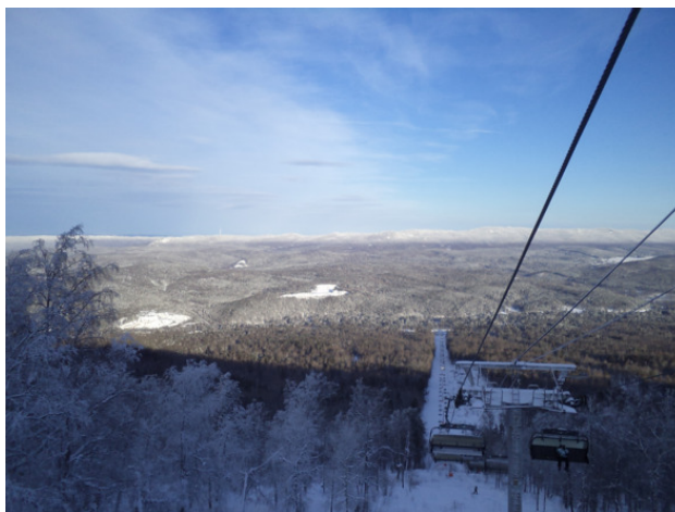
ГЛК «Завьялиха», подъёмник.

На следующий той же компанией ранним утром закатываем на пейнтбольное поле. Тут свои особенности игры на морозце. От дыхания стёкла защитных масок запотевают, и после пяти вдохов-выдохов перед глазами только белая полоса прилипшего к стеклу дыхания. Все бегают от укрытия к укрытию, как полуслепые котята. Приходится постоянно у организаторов просить баллончик с жидкостью, защищающей стекла от запотевания, но и она не спасает надолго. Вымазав команду противника зелеными шлепками, заработав по несколько синяков на теле от замерзших на морозе патронов-шариков с краской и получив очередной заряд бодрости на неделю вперед, после обеда едем на «Форельку», небольшую базу отдыха на берегу озера Тургояк, где нас уже ждет прогретая сауна и почищенная прорубь.