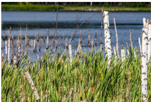
оз. Тургояк, бухта Мухоринская

Купаться со всеми я не пошел, только ополоснул кеды, замазанные черной илистой грязью еще во время прохода через эту речку Бобровку. Вернее, даже не через нее саму, а через заболоченную низменную пойму. Мы скакали по кочкам и по веткам, в густых зарослях цветущего иван-чая едва находя тропу, ежесекундно чавкая ногами по грязи и черпая обувью эту вонючую жижу. Зайдя после походного обеда в воду, я пополоскал пропитанные грязью и потом кеды, не снимая с ног, огляделся. Левее нас начинались бескрайние заросли камыша, а из воды между ним торчали сухие обломки берез. Безрадостная картина. Эти погибшие в воде березы напомнили мне кладбище со старыми, покосившимися крестами.