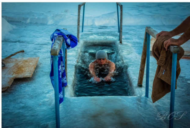
База отдыха «Форелька», зимняя прорубь...

А дальше начинается чудо! Тело горит! Жар исходит изнутри и распространяется не только на тебя, но и на расстояние вытянутой руки. Облако пара окутывает тело, как будто кто-то плеснул воды на горячие камни в бане. Ощущение такое непередаваемое, что окружающие отдыхающие, следившие за твоими предыдущими действиями в сторонке, поднимают повыше воротники, поглубже нахлобучивают шапки и вертят у виска. Тапки примерзают к поверхности льда, волосы после окунания уже замерзли, как ирокез у панка, а тебе хочется, распластав руки, еще постоять на свежем воздухе, взять фотоаппарат и запечатлеть остальных купальщиков. И пусть на улице минус двадцать семь, ведь в воде озера – целых плюс четыре! Жара фактически.