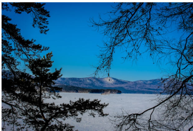
оз. Тургояк, вид с берега на Заозёрный хребет, зима.

У прибрежных скал меня ждала еще одна сказочная картинка в виде причудливых сосуллек, равномерно свисающих у кромки льда с камней. Слипаясь между собой, они создавали впечатление этакой хрустальной юбочки. Их форма была совсем не похожа на обычные сосульки на крышах домов. Больше они напоминали застывшие огромные капли, как последний всплеск волны на берег перед последующим замерзанием. Или как замерзшие слёзы на глазах скал. В лучах солнца они переливались всеми цветами радуги и поднимали настроение.