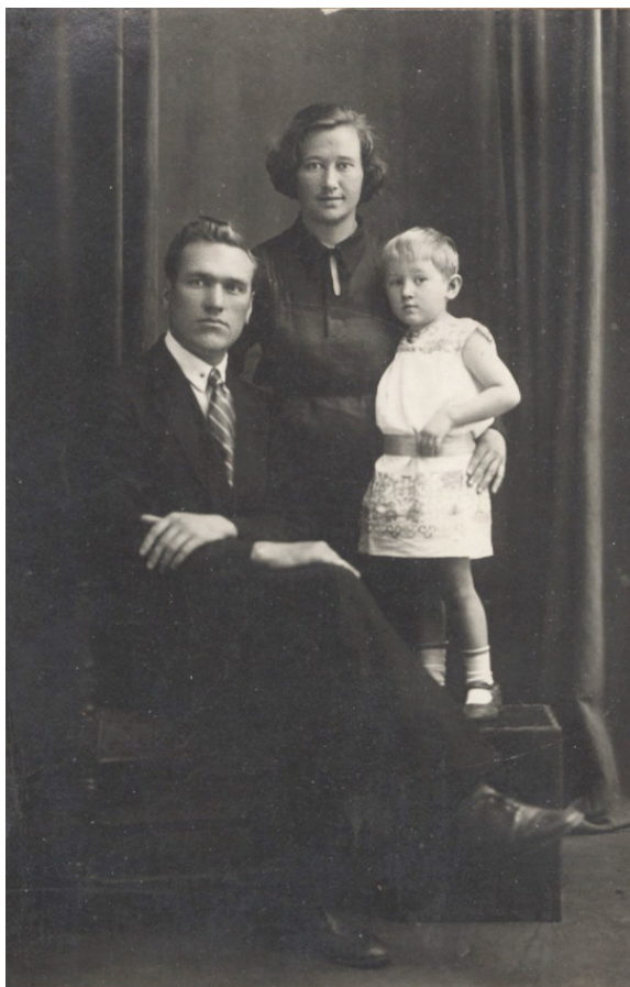
Довоенная фотография. Вот наша семья

Паровоз засвистел. Все трое крепко прижались друг к другу. Стукнули колеса. Папа поставил меня на подножку вагона, обнял маму, и они долго махали руками вслед своему единственному дорогому дитятке, которого отнимала у них война.