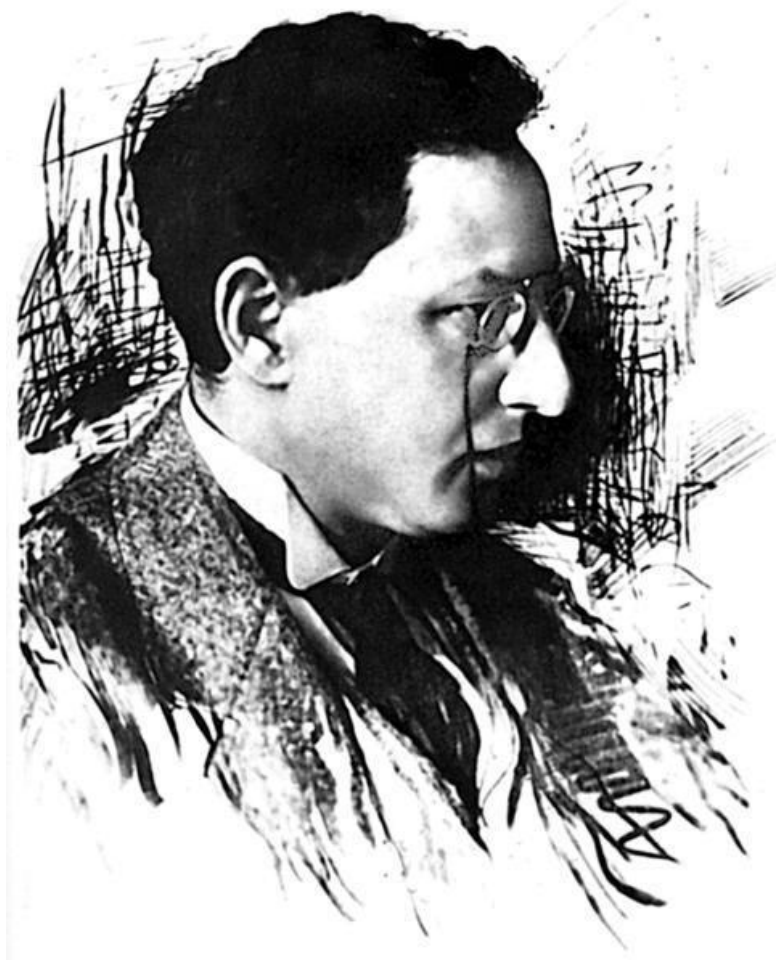
М. С. Урицкий