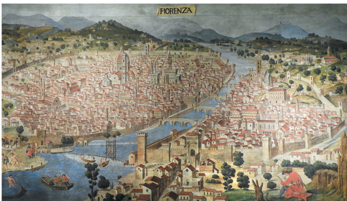
Франческо ди Лоренцо Розелли. Вид Флоренции, или Carta della Catena. 1470-е гг.

Неподалеку от городских стен шумит стайка обнаженных рыбаков-аполлонов. Напрягая мускулы, красивые, словно античные статуи, они тянут гигантский невод – кажется, поймали саму реку Арно. Бурная река бьется в их сетях, словно Флоренция в сетях фортификаций. Эта рифма, подсказанная случаем, тоже попадет в альбом набросков внимательного художника. Но есть и другое созвучие, ведь Флоренция – истинно поэтический город: вороны клюют оливковую плоть падшей клячи, а поодаль послушный плетке мул тащит тяжелые выюки. В этой рифме – мораль: работа – смысл жизни, гарантия долголетия и процветания города. Аньоло Пандольфини, тосканский рифмоплет и чиновник, говаривал: «Non e nato l'uomo per vivere dormendo, ma per vivere facendo» – «Человек рожден не для сна, а для работы». Истинно так.