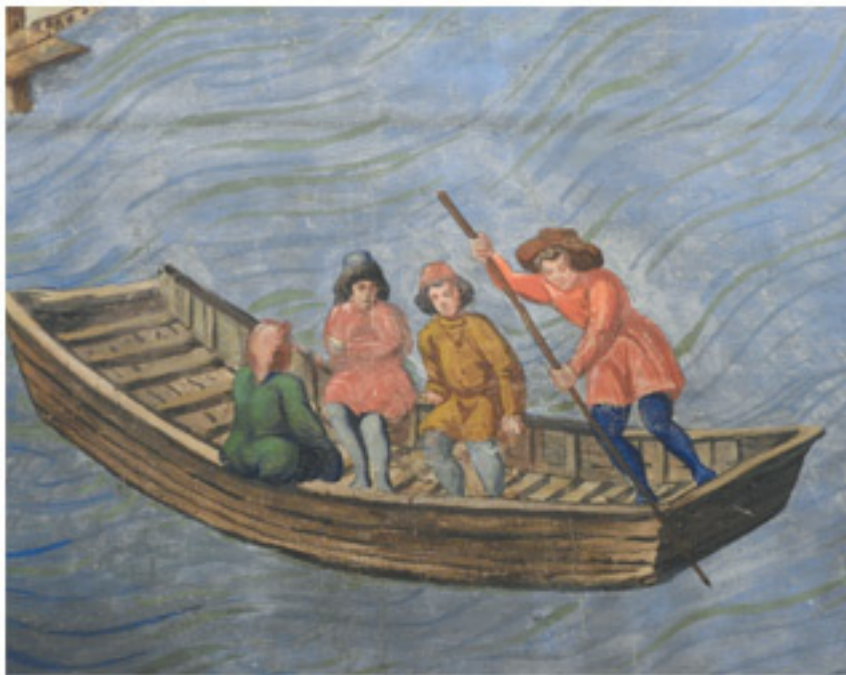
Лодочник, перевозящий молодых щеголей. Деталь «Вида Флоренции, или Carta della Catena»