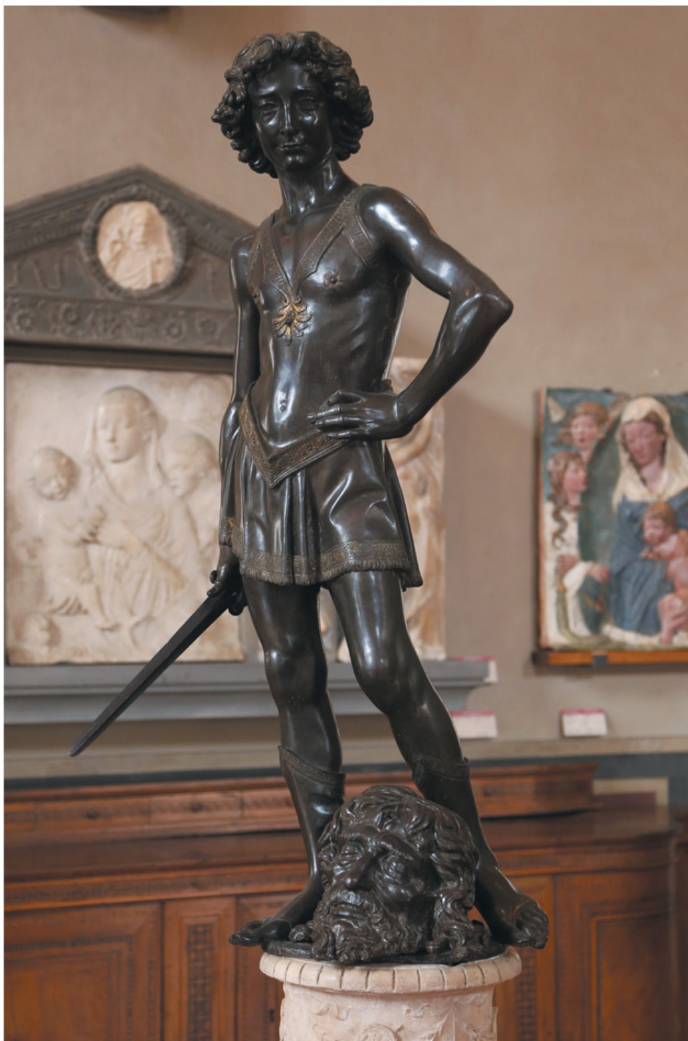
Андреа Верроккьо. Давид. 1460-е гг.

Давид – идеал красоты молодежавой Флоренции. Теперь скульптуру датируют серединой 1460-х и видят в ней юного Леонардо, который якобы послужил Верроккьо моделью. Голову поверженного Голиафа у давидовых ног считают автопортретом самого скульптора, который был необычайно отзывчив на юношескую красоту, натерпелся от балованных эфебов и часто терял от них голову. Дерзкий Давид безразличен и неумолим. Он слегка отвел стройную ногу и, кажется, сейчас пнет голову поверженного врага, словно мяч. В этом бронзовом шедевре – трагедия и юмор одновременно. Верроккьо, как многие гениальные итальянцы, умел шутить сквозь слезы.