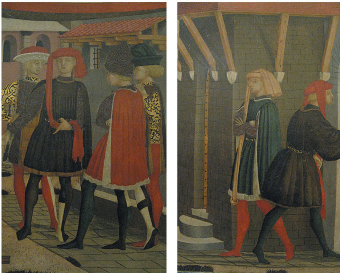
Флорентийские щеголи. Деталь росписи свадебного сундука. 1460-е гг.

Вазари, кажется, первым отметил это его умение – нравиться всем без исключения. Да Винчи, от рождения деликатный и обходительный, обладал хорошими манерами, чувством юмора и «безграничной прелестью в любом поступке» (Вазари – мастер формулировок). Но главной его юношеской добродетелью, привлекавшей молодых львов, была аристократическая утонченная красота, счастливо совпавшая с флорентийскими представлениями о прекрасном эпохи Кватроченто.