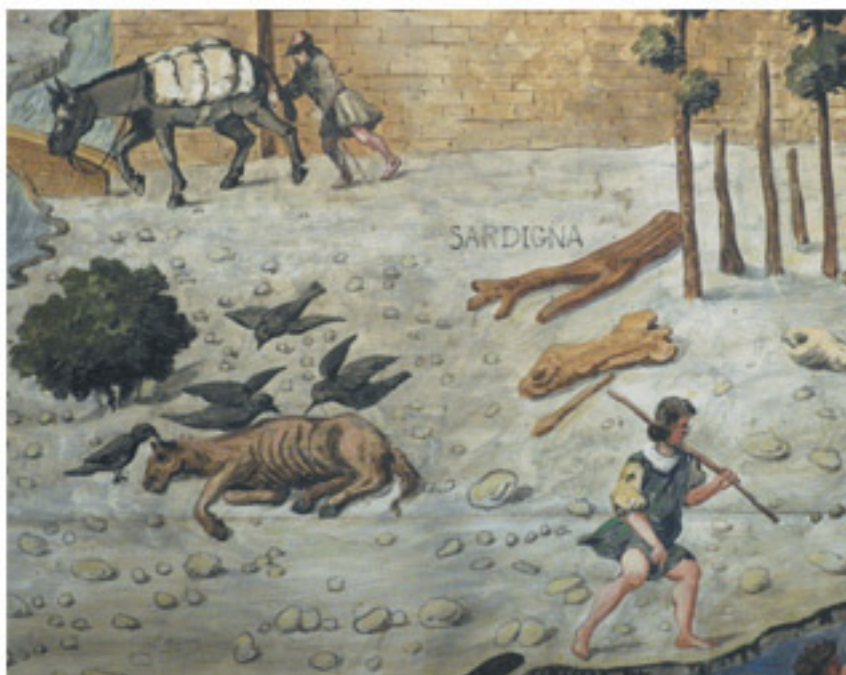
Мул и падшая кляча. Деталь «Вида Флоренции, или Carta della Catena»

Carta della Catena, детальное изображение Флоренции 1470-х годов, выставлена в Палаццо Веккьо. Считается, что ее автор – Франческо ди Лоренцо Розелли и что это первый масштабный план города Медичи. Но для меня это портрет не только ритмичной, поднимающейся Флоренции, но и молодого да Винчи. Художник на этой картине очень его напоминает.