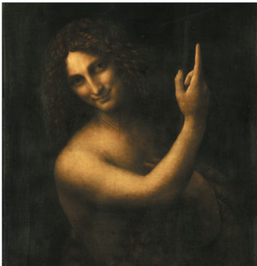
Леонардо Да Винчи. Иоанн Креститель. 1513 г.

«Ангел во плоти» выбалтывает о личной жизни да Винчи то, о чем красиво молчат другие его златокудрые юноши-полубоги. Для меня этот поздний андрогин – шутовское воспоминание гениального старика о молодых флорентийских годах, о беспечном, озорном времени, когда все казалось доступным, забавным и легким, когда аппетитные синьорины и утонченные эфебы были ему одинаково желанны, когда он, юный красавец, постигал азы любви на темных улицах и в душных кабаках, где бессовестно наслаждался анатомией (хладнокровно ее изучать стал много позже).