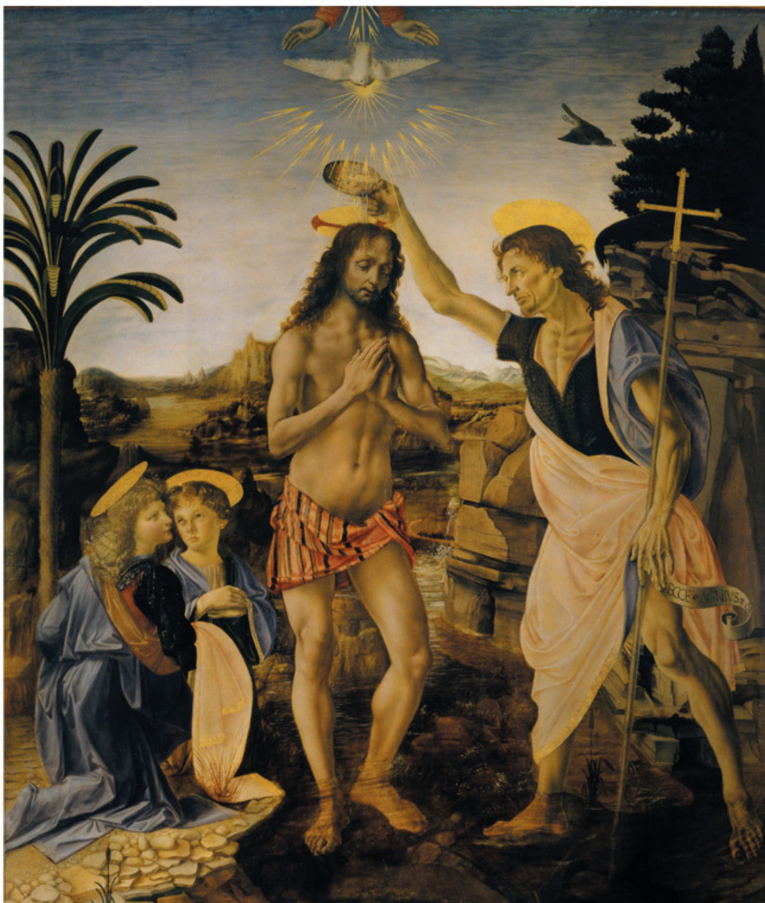
Андреа Верроккьо. Крещение Христа. 1472–1475 гг.

В искусстве и жизни да Винчи были другие андрогины, равные богам. Их изображения встречаются на рисунках зрелого периода. Некоторые теперь считаются портретами хулигана Салаи, писаного красавца, ученика художника. Необычайно соблазнителен Иоанн Креститель, позднее творение мастера. Он слишком женственен и откровенно сексуален для бескомпромиссного библейского фанатика. На его змеистых устах истаявает усмешка. Он потешается над современными учеными, всерьез пытающимися установить его пол, нащупать гендерные признаки под слоями лака и красок. Наивные глупцы, скучнейшие из скучных.