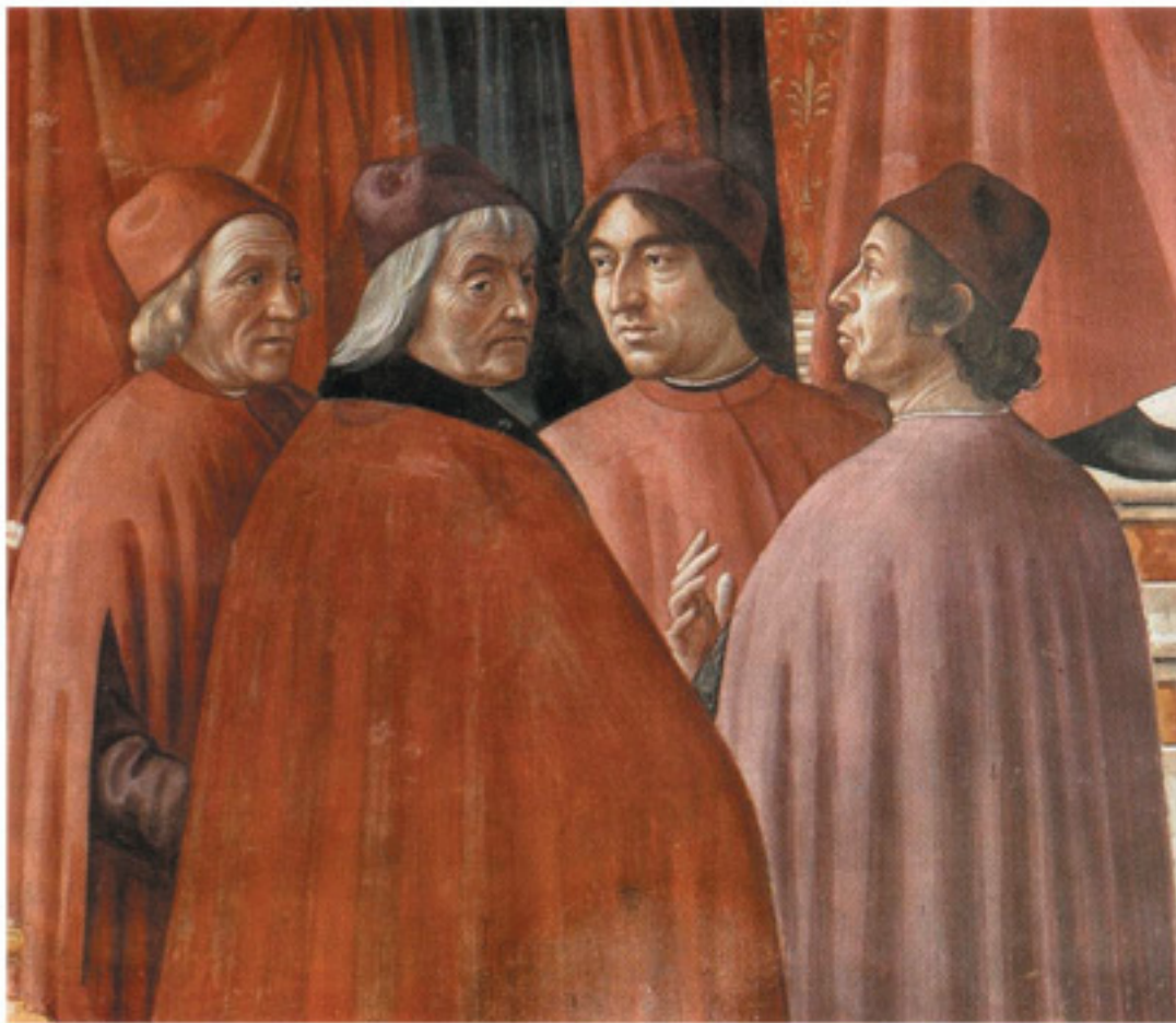
Доменико Гирландайо. Деталь фрески «Явление ангела Захарии». 1490 г.

Знал он и то, с чем рифмуется ее имя. Джиневра (Ginevra) созвучно ginepro , с итальянского – «можжевельное дерево». Его листва вечерним сумрачным облаком окружает даму, и кажется, будто кто-то невидимый склоняется над ее холодным мраморным челом, нежно обнимает затянутый в монашеское платье стан, овивает темными лентами плечи и грудь. Возможно, в этом печально-романтическом древесном облике художник изобразил самого заколдованного любовью заказчика, которому не суждено быть рядом с замужней Джиневрой.