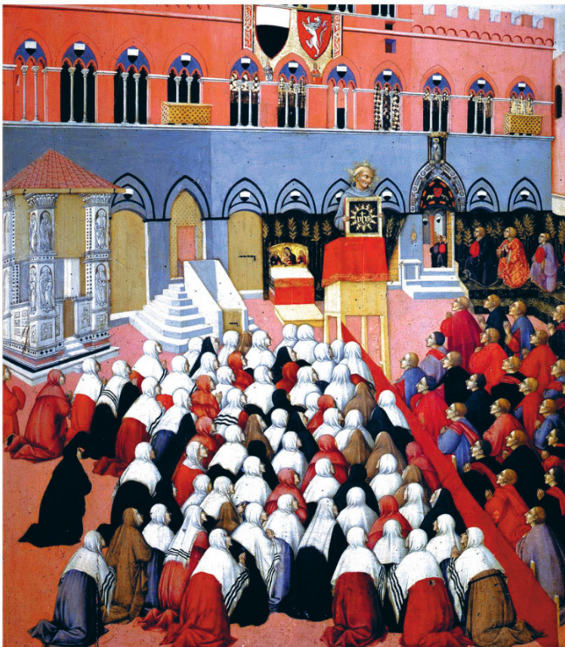
Сано ди Пьетро. Бернардино Сиенский проповедует на площади Кампо. Деталь. 1445 г.

Проповедник много кричал о costume. О том, к примеру, что одевать мальчиков в роскошные вещи – грех, особенно если они сшиты по-флорентийски, то есть короткие куртки, короткие плащи, тонкие чулки. Эти мерзкие вещи, по мнению францисканца, привлекают к молодым людям внимание содомитов, ведь куртки открывают их ноги, облегающие кальче подчеркивают их чресла. И даже, возможно, продолжал Бернардино, юноши сами выбирают такие наряды для выгодного знакомства с престарелыми греховодниками.