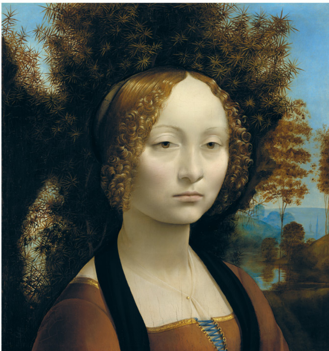
Леонардо да Винчи. Портрет Джиневры де Бенчи. 1474–1478 гг. Национальная галерея, США

Поверх вуали – неширокая черная драпировка. Одни считают, что это элемент монашеского одеяния, который (как и цвет платья) отсылает к юности де Бенчи, проведенной в бенедиктинском монастыре. Другие видят в ней намек на связь Джиневры с платоновской академией, членом которой был поэт Ландино. Он изображен в похожей шали на фреске Гирландайо. Недавно историк моды Сара ван Дийк предположила, что это коларетто, драпировка, украшавшая верхние платья дам. Регламент их не запрещал, они фигурируют в перечнях имущества.