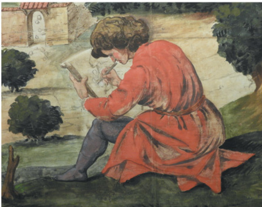
Молодой художник. Деталь «Вида Флоренции, или Carta della Catena»

И черты художника на Carta della Catena – длинные волнистые волосы, утонченный профиль, стройная сосредоточенная фигура, его интерес к архитектуре, о котором говорит ровная череда башенок на рисунке, и место его благородного труда – истинно леонардовские. Он сидит в тени деревьев, под самым божественным небосводом. В торжественном одиночестве наблюдает за жизнью, стремится поймать ее в сети штрихов. Он уже очертил ее силуэт. И вскоре будет исследовать ее плоть: архитектуру, анатомию, химию, биологию, ботанику, оптику, скульптуру, живопись.