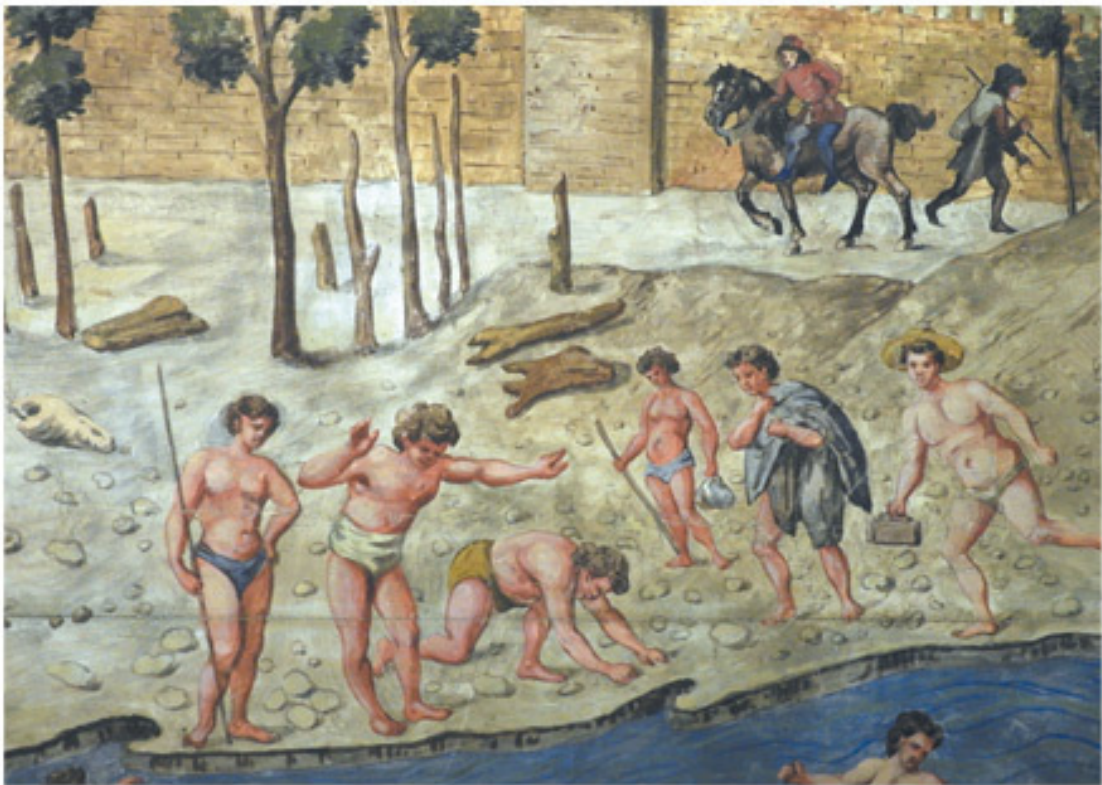
Рыбаки. Деталь «Вида Флоренции, или Carta della Catena»

И мул, и бегущий за ним очень занятой хозяин, и обнаженные рыбаки, и античные эфебы, строящие плотину на Арно, и те утонченные молодые люди, которых перевозит силач-лодочник (и, верно, сыплет грубыми шутками, издевается над хлюпкими щеголями), и мирно беседующие дельцы, и всадник за ними, и торопливый ремесленник, спешащий на Меркато Нуово, и сам художник, элегантный и сосредоточенный, с высоты холма наблюдающий за бойким, ритмичным, шумным, вечно строящимся городом, – все они похвально безостановочно трудятся. Все они истинные флорентийцы.