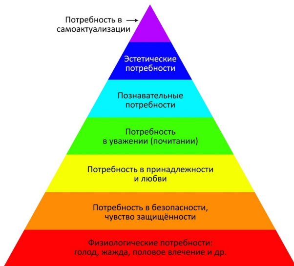
Рис.1. Пирамида потребностей Маслоу.

Все слышали о знаменитой пирамиде потребностей Маслоу (рис.1), где на нижнем уровне находятся наши физиологические потребности, в том числе и питание, а на верхнем – самоактуализация.