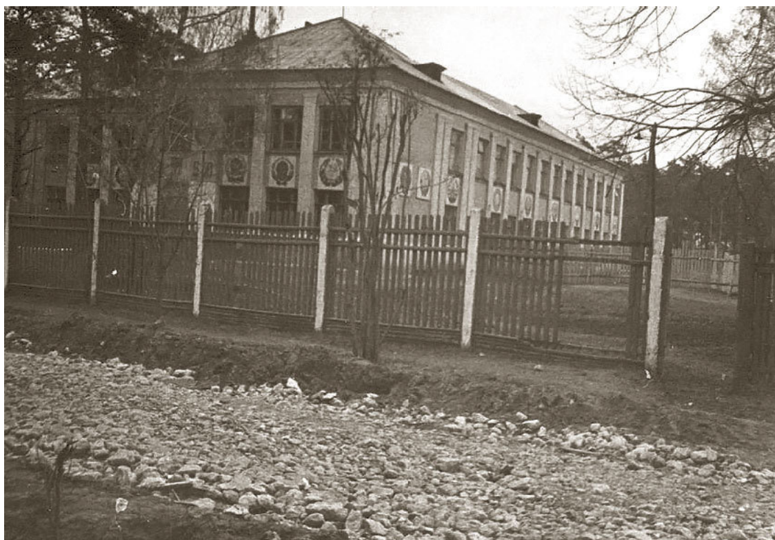
Средняя школа № 25 в Ильинском

В десять лет его приняли в пионеры, о чем он поведал в своем рассказе «Девяносто пять минут», как и о том, что в 1937-м совсем, было, собрался с другом в Испанию защищать республиканцев, да родители своевременно пресекли эту попытку. Вместо Испании ему пришлось ехать в Ялту, в пионерский лагерь.