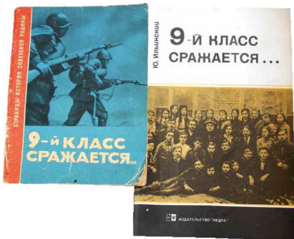
Первое (1963 г.) и последнее (1995 г.) издания книги о 9 «Б»