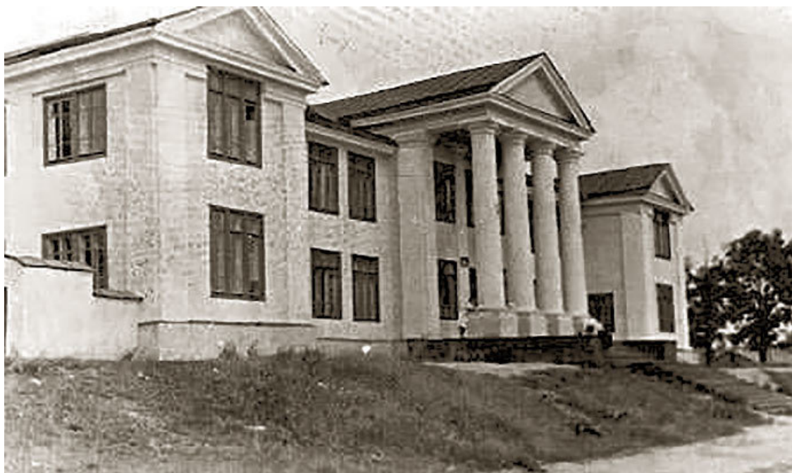
Средняя школа в Икие, построенная в мае 1937 г.