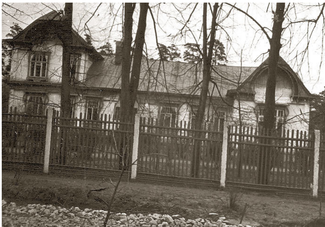
Начальная школа. Первый класс