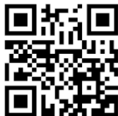
Рис. 2. Штрих-код для доступа к онлайн-программе для определения лунного знака зодиака

На рисунке 3 показано, как выглядит эта программа при первом посещении.