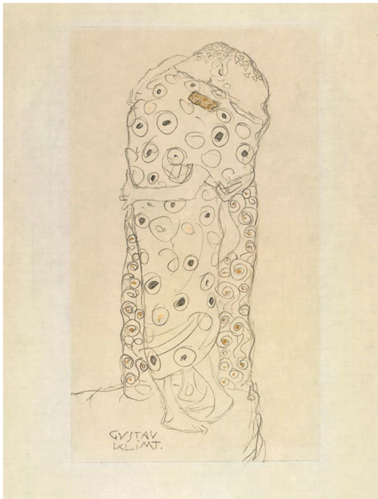
Густав Климт. «Стоящая пара влюбленных, вид сбоку».