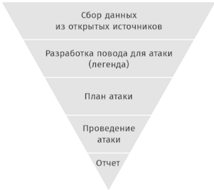
Илл. 1.3. Пирамида СИ