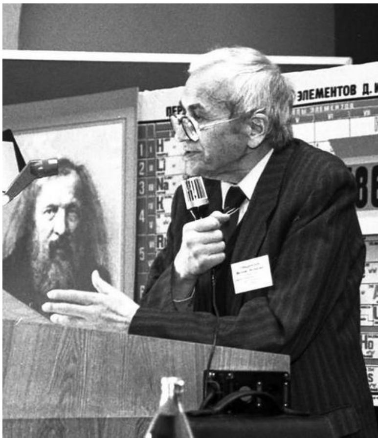
Виталий Иосифович Гольданский (1923–2001) – советский и российский физико-химик и общественный деятель. Академик РАН (1981, член-корреспондент с 1962). Лауреат Ленинской премии.