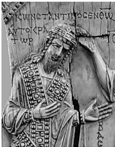
Император Константин Багрянородный

Установив порядок в Русской земле после своего воинственного супруга, Ольга вернулась в Киев, где жила, любимая и чтимая сыном и народом.