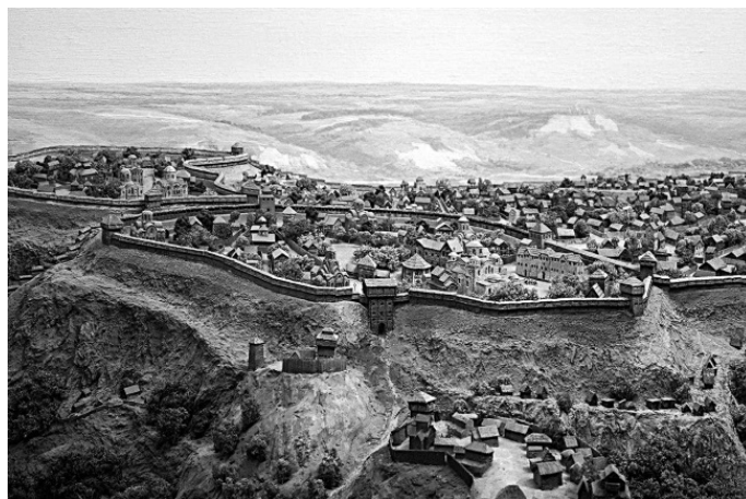
Древний Киев. Реконструкция

Славя память ее, Церковь поет ей трогательную песнь: «Крилами Богоразумия вперивши твой ум, возлетела еси превыше видимыя твари, взыскавши Бога и Творца всяческих, и Того обретши, паки рождение крещением прияла еси, древа животного наслаждающихся, нетленно вовеки пребывавши, Ольга приснославная!»