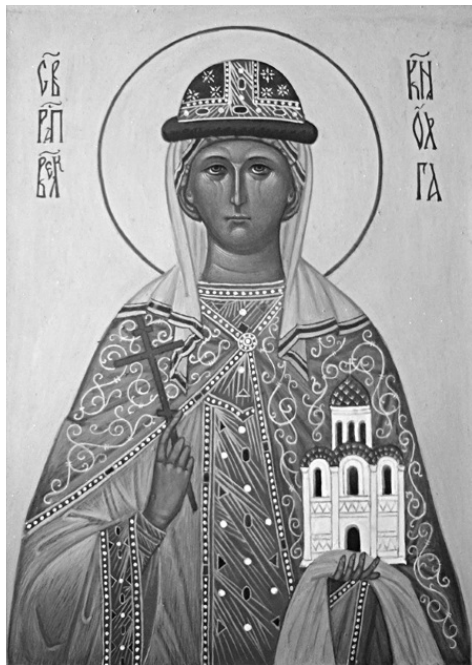
Святая княгиня Ольга

Мало-помалу готовилась почва, благоприятная для христианства, и первой провозвестницей его на Руси явилась равноапостольная великая княгиня Ольга.