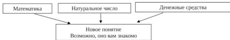
Рисунок 3. Схема введения нового понятия

В конце урока я попрошу назвать это новое понятие и объяснить его связь с математикой, деньгами, натуральными числами.