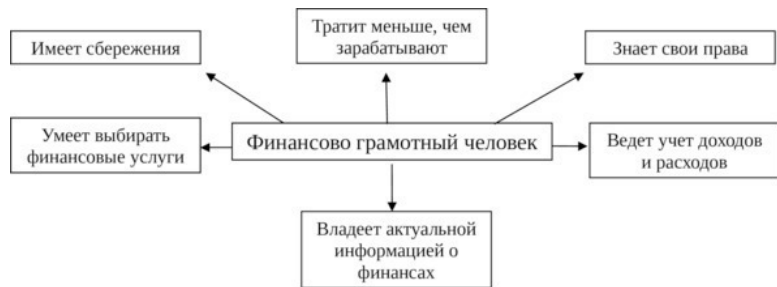
Рисунок 4. Система качеств финансово грамотного человека

– Ребята, обратите внимание на слайд (Финансово грамотный человек). Кто такой финансово грамотный человек? Как вы думаете, почему именно эти качества обязательно должны быть у финансово грамотного человека?