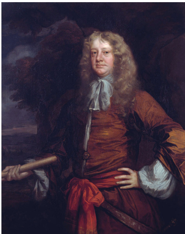
Вице-адмирал Джордж Эскью (1616 – 1672)

Голландская эскадра, плывущая на северо-запад, находилась с невыгодной для боя подветренной стороны. Авангардом голландцев командовал контр-адмирал Йорис Питерсзун ван ден Брок; сам де Рюйтер командовал центром, а контр-адмирал Ян Аертсен Верхофф командовал арьергардом.