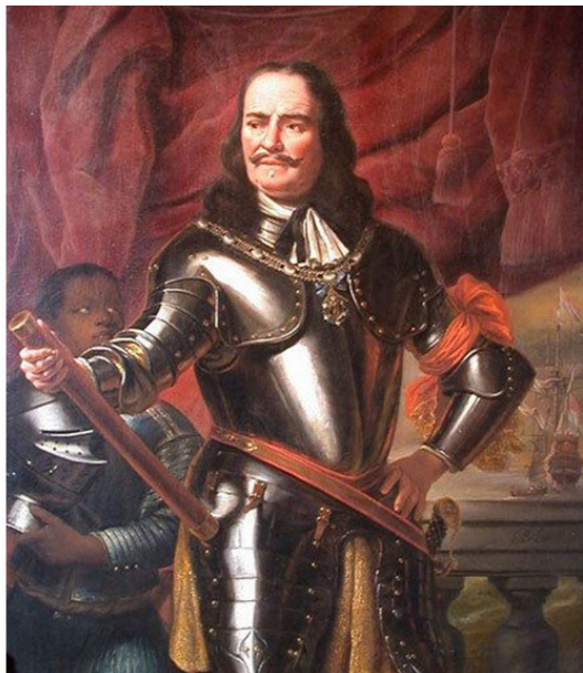
Микаэл Адрианзон де Рюйтер (1607 – 1676)