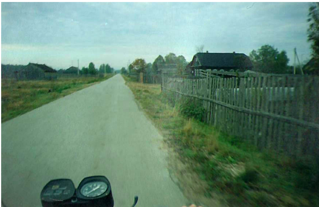
Фотография № 4. «Рассекаем!»

Сделана из-за спины физрука, когда мы едем на работу, вдвоём оседлав мотоцикл. Асфальтовая дорога уходит к самому горизонту, справа тянется убогая изгородь из тонких сереньких дощечек, видны кое-какие домишки. Посёлок, где мы живём, возник сравнительно недавно, в советское время, построен на тят-ляп: дома, больше похожие на бараки, от времени посерели. Довольно жалкое зрелище. Пример того – школа.