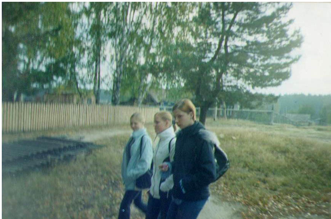
Фотография № 6. «На занятия»

Три ученицы 11 класса идут в школу. Один парень из тех, что закончил школу два-три года назад, сказал мне с большим удовольствием в голосе, рассматривая этот снимок: «Я их всех знаю, а эту особенно близко». Как мне потом сообщили, ту, о ком он говорил, знали подобным образом многие.