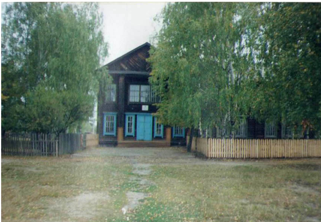
Фотография № 5. «Школы дом обветшалый»

Сделана из-за спины физрука, когда мы едем на работу, вдвоём оседлав мотоцикл. Асфальтовая дорога уходит к самому горизонту, справа тянется убогая изгородь из тонких сереньких дощечек, видны кое-какие домишки. Посёлок, где мы живём, возник сравнительно недавно, в советское время, построен на тят-ляп: дома, больше похожие на бараки, от времени посерели. Довольно жалкое зрелище. Пример того – школа.