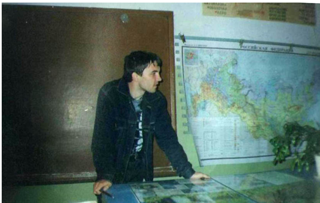
Фотография № 7. «Педагог рулит»

Три ученицы 11 класса идут в школу. Один парень из тех, что закончил школу два-три года назад, сказал мне с большим удовольствием в голосе, рассматривая этот снимок: «Я их всех знаю, а эту особенно близко». Как мне потом сообщили, ту, о ком он говорил, знали подобным образом многие.