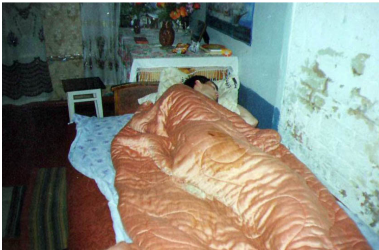
Фотография № 1. «Пора вставать, Андрей Сергеевич!»

На этом утреннем снимке я сплю на диване под одеялом, на котором нет пододеяльника. Справа от меня ободранный бок печи, позади столик с мелким барахлом: походными шахматами, вазой с искусственными цветами, пакетиком сухариков, часами, книжкой, фотографией в рамке. На той фотографии, что стоит на столе, изображён один из эпи-