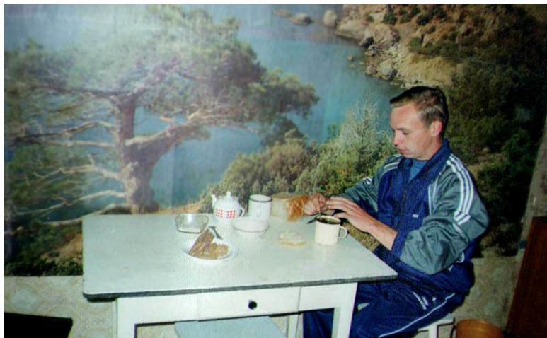
Фотография № 2. «Скудный учительский завтрак»

В домике две комнаты, не считая кухни. В большой комнате обитаю я, в маленькой – физрук. Кстати, вот и он.