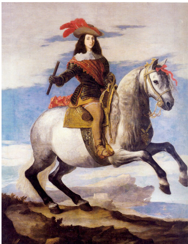
Хосе Рибера. Портрет Хуана Австрийского.

Хосе де Рибера с радостью с радостью согласился разместиться в покоях вельможного покровителя. Но небескорыстной была забота принца о семье художника. Не знал отец семейства о нечистой страсти, распалюющей высокопоставленного франта. Хуан был пленен образом, запечатленном на картине, и давно искал случая познакомиться с девушкой, послужившей моделью.