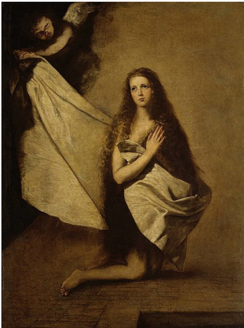
Хосе де Рибера. Святая Инесса

На картине мы видим совсем юную деву: коленопреклоненную, с молитвенно сложенными руками и взглядом, обращенным к небу. Струящиеся волосы укрывают ее от нескромных взоров, и ангел, спускающийся с небес, окутывает ее белым полотном. Образ святой Инессы передает спокойную непоколебимость, торжество веры, готовность к ее исповеданию и принятию мученической кончины.