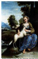
Онорио Маринари. Святая Инесса (Агнесса) (XVII в.)