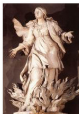
Марко Бенефиал (1750). Мученичество Святой Инессы (Агнессы). Церковь Сантиссима Тринита дельи Спаньоли в Риме.