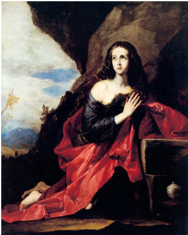
Хосе Рибера. Кающаяся Мария Магдалина