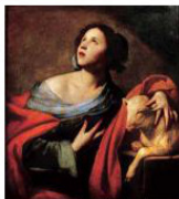
Massimo Stanzioni, S. Agnese, XVII sec.

Доменикино. Святая Инесса (Агнесса) (XVII в.)