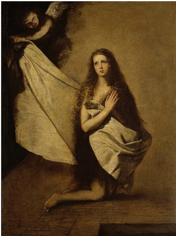
Хосе де Рибера. Святая Инесса

На картине мы видим совсем юную деву: коленопреклоненную, с молитвенно сложенными руками и взором, обращенным к небу. Струящиеся волосы укрывают ее от нескромных взоров, и ангел, спускающийся с небес, окутывает ее белым полотном. Образ святой Инессы переда-