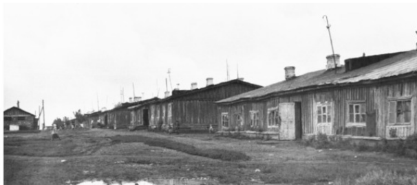
Уфа. Сталинский район. Бараки на улице Лаврентия Берии (ныне улица Мира). 1941 г.

Рядом с мамой – папа. Увидел нас, подхватил на руки, закружил, потом поставил на землю, в обе руки набрал сразу по нескольку узлов, и мы пошли за ним к своему новому пристанищу.