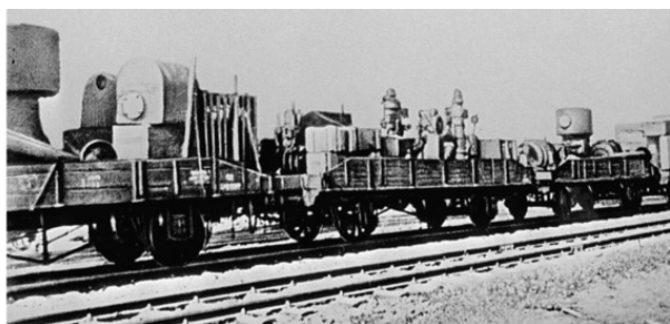
Эшелон с эвакуируемым на Восток оборудованием завода

Мы эвакуировались в товарных вагонах. Внутри вагонов – двухъярусные, наспех сколоченные полки из плохо обструганных досок. Нам досталось место на втором ярусе. Посередине вагона поставили печку-буржуйку, на которой можно было вскипятить воду или сварить кисель, а у дверей – ведро, в которое все, не стесняясь, справляли малую нужду. Грузились ночью в полной темноте и тишине. Поезд стоял на территории завода, чуть дальше за зданием ОКБ. Первые вагоны были предназначены для семей, а дальше цеплялись платформы со станками и оборудованием завода. У станков на платформах круглосуточно дежурили мужчины.