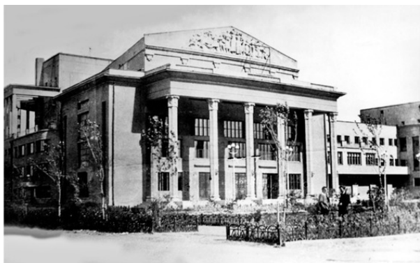
Дворец культуры двадцатого завода в годы моего детства

Тетя Маня замужем не была, всю жизнь проработала заведующей читального зала библиотеки Дворца культуры 7 .