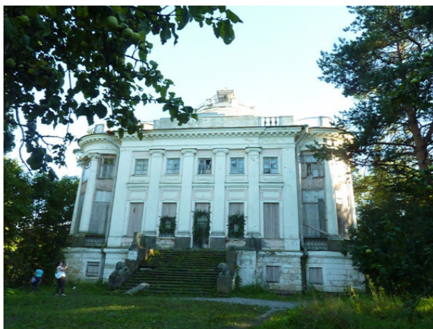
Тайцы. Современный вид старинной усадьбы

Знаменитый горнопромышленник Александр Григорьевич (1737—1803) из рода Демидовых пригласил молодого архитектора И.Е.Старова (1745—1808) в свое новое имение.