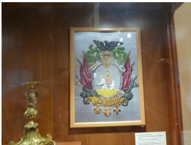
Суйда. Герб Ганнибала. Работа стеклярусом