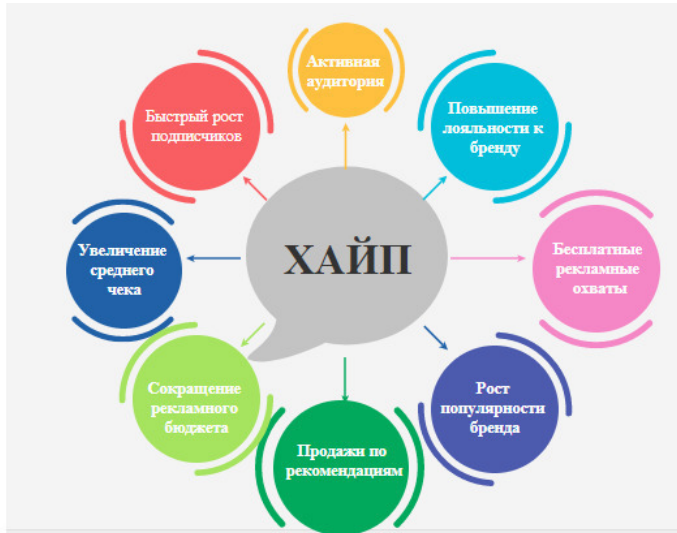
Рисунок 1 – Что нам даст хайп?