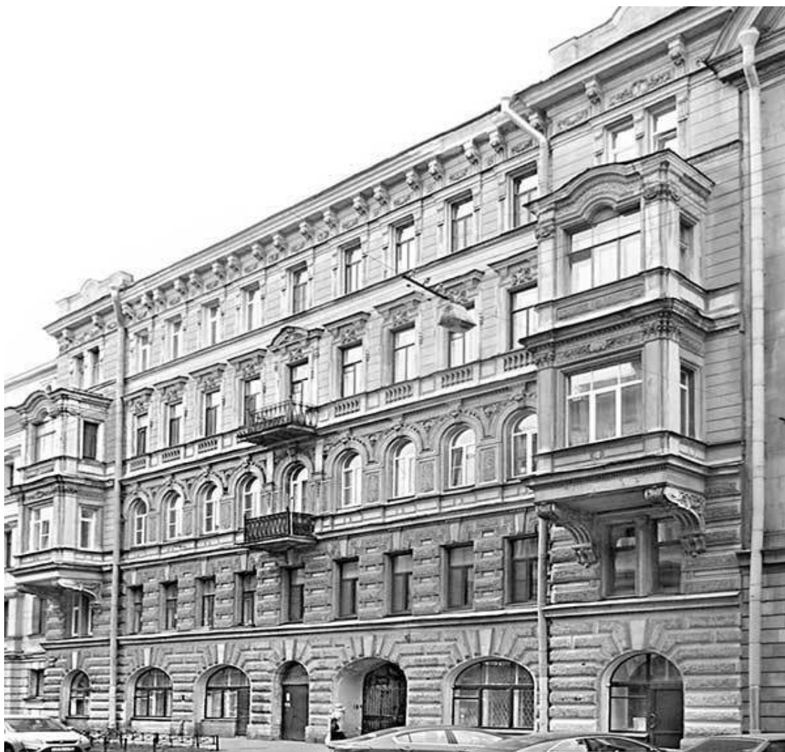
Моховая улица, 17