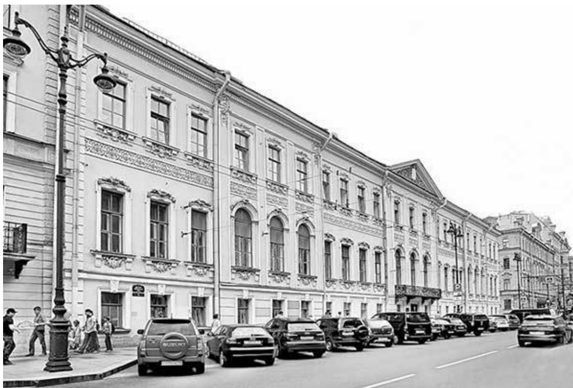
Малая Морская улица, 10

Именно в эти окна всматривался одержимый азартом Германн, герой пушкинской «Пиковой дамы», в надежде проникнуть в таинственный дом и узнать карточный секрет сварливой старухи-графини.