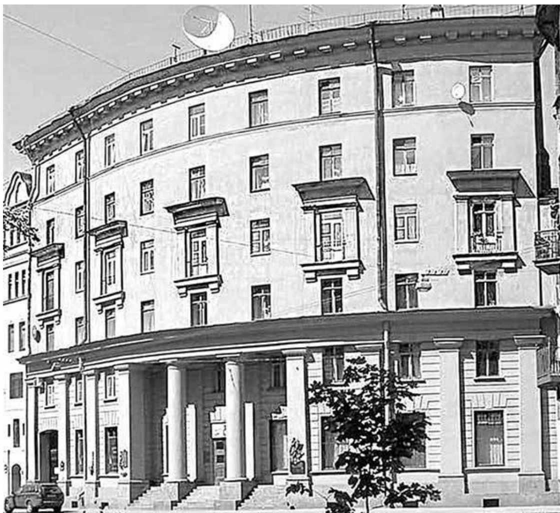
Малая Посадская улица, 8

Шварц с женой быстро привыкли к своим «Афинам», выглядывая из этих самых окон второго этажа на площадку, с которой поднимались ввысь массивные колонны, вызывавшие бесчисленные фантазии писателя.