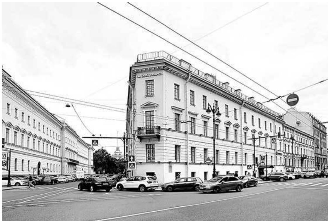
Вознесенский проспект, 8