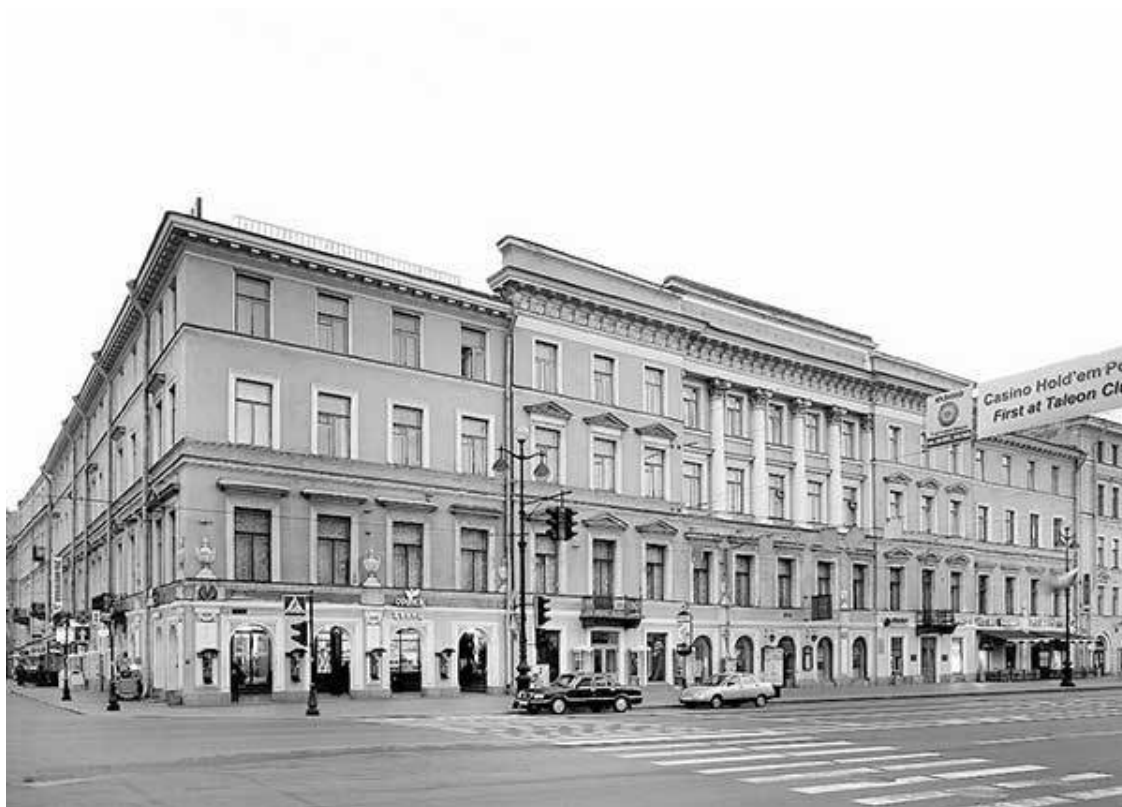
Невский проспект, 30 / Наб. канала Грибоедова, 16

Сюда, в дом на углу Невского проспекта и канала Грибоедова, в дом, где сейчас располагается вход в вестибюль станции метро «Невский проспект», светская дама Долли Фикельмон привела на маскарад императрицу Александру Федоровну, супругу Николая I. Обeim было в то время около 30 лет, и они все еще обожали веселиться и танцевать до утра.