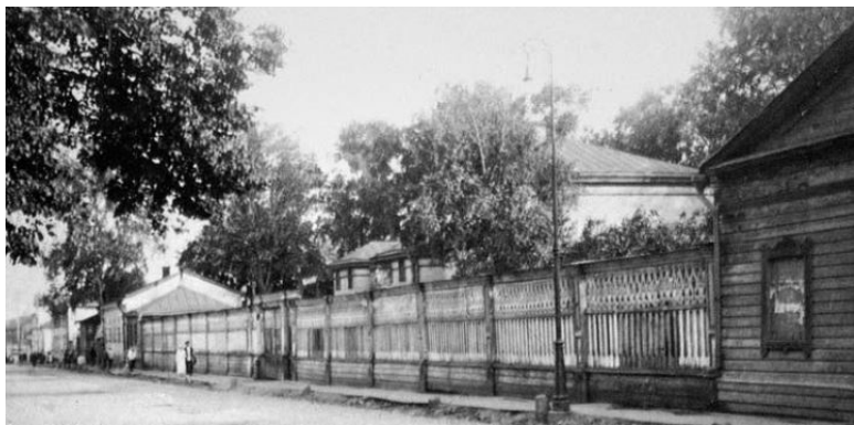
Долгохамовнический переулок, 1900-е годы