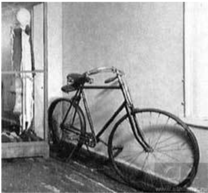
Любимый велосипед писателя