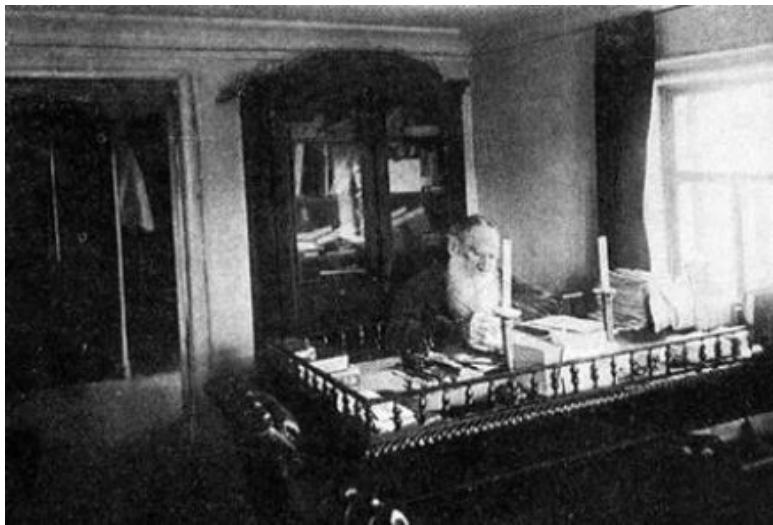
Лев Толстой в кабинете за столом

Как и в Ясной Поляне, сидел он на низком стуле, ножки которого были укорочены — чтобы ему было лучше видно, так как Лев Николаевич, будучи близоруким, очков не носил. Судя по всему, писать, сидя на таком стуле, было не очень удобно, ведь роста Толстой был высокого. Иногда после долгих часов сидения за столом он вставал и подходил к пюпитру, ставя его к окну, продолжал писать на нем. Любил писать при одной свече.