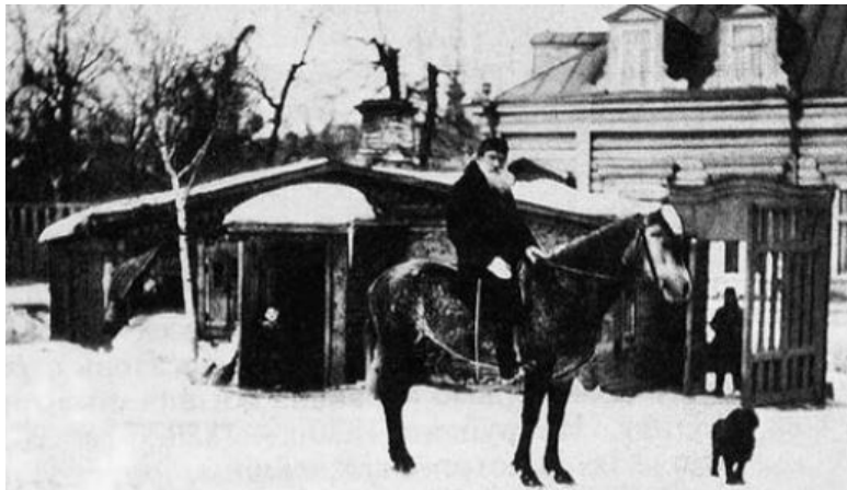
Лев Толстой верхом на лошади

Видели москвичи знаменитого писателя верхом на лошади. Кружит он по московским улицам и на велосипеде. Обучался Толстой велосипедной езде в апреле 1895 года в Манеже, куда его поначалу не хотел пускать вахтер, так как не мог поверить, что человек в черной блузе и сапогах и есть тот самый граф. Это был далеко не первый подобный случай. Как-то Льва Николаевича, пришедшего в консерваторию в тулупе и в валенках, не узнал швейцар (консерватория тогда находилась еще на Воздвиженке, на месте нынешнего сквера перед станцией метро «Арбатская»).