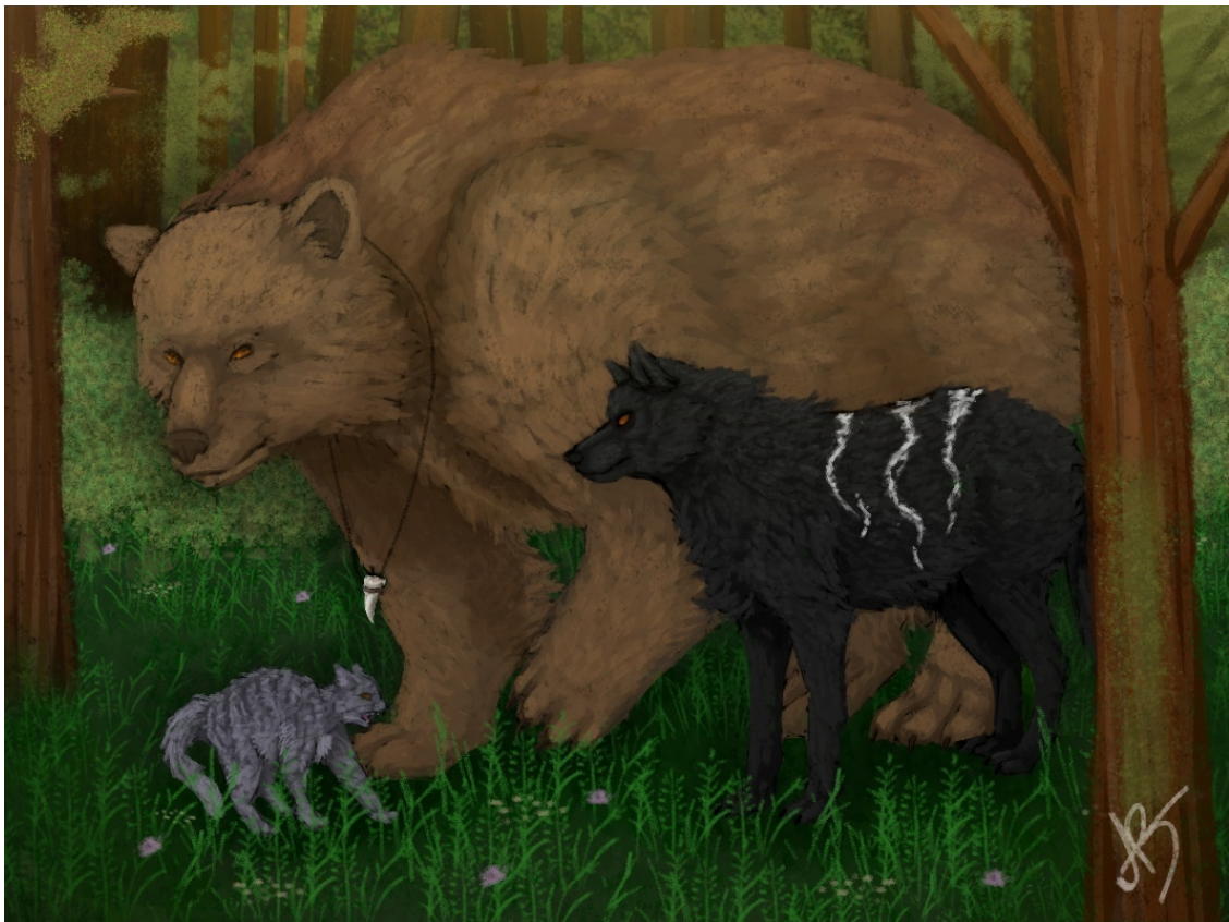
Художник: Калинина Александра Владимировна

Легатов оглушил тяжелый звериный рев. Позади них, немного качаясь, на задних лапах стоял громадный медведь. По амулету в нем признали Рейгара. Медведь подошел к кошке и толкнул её в бок тяжелой лапой, свалив её с ног. В глазах зверя можно было прочитать раскаяние. Кошка зашипела и вспрыгнула ему на спину. Там она легонько прикусила медведя за круглое ухо, всем своим видом показывая, что ничуть не боится его и не держит на него обиды. Зверь притворно взвыл, будто от боли, и тяжело повалился на бок, чуть не придавив кошку, но та выскользнула и начала победоносно прыгать по поверженному хищнику. Венус заливалась смехом, наблюдая за легатами, но Инвер их веселья не разделял. Как только он увидел обращенного Рея, весь его задор как рукой сняло, и волк снова посерьёзnel.