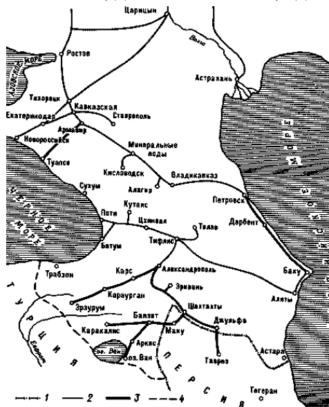
Схема железных дорог Кавказского района: 1 – государственная граница до 1917 г.; 2 – дороги, построенные до 1900 г.; 3 – дороги, построенные в 1900–1917 гг.; 4 – линия фронта во время Первой мировой войны.

Экономический и культурный подъем в Карсе пришелся на 1907–1917 гг. Население города к 1917 г. составляло 37 тысяч человек. Функционировало двенадцать церквей (русских, греческих и армянских), шесть мечетей, десять библиотек, один театр и два кинотеатра.