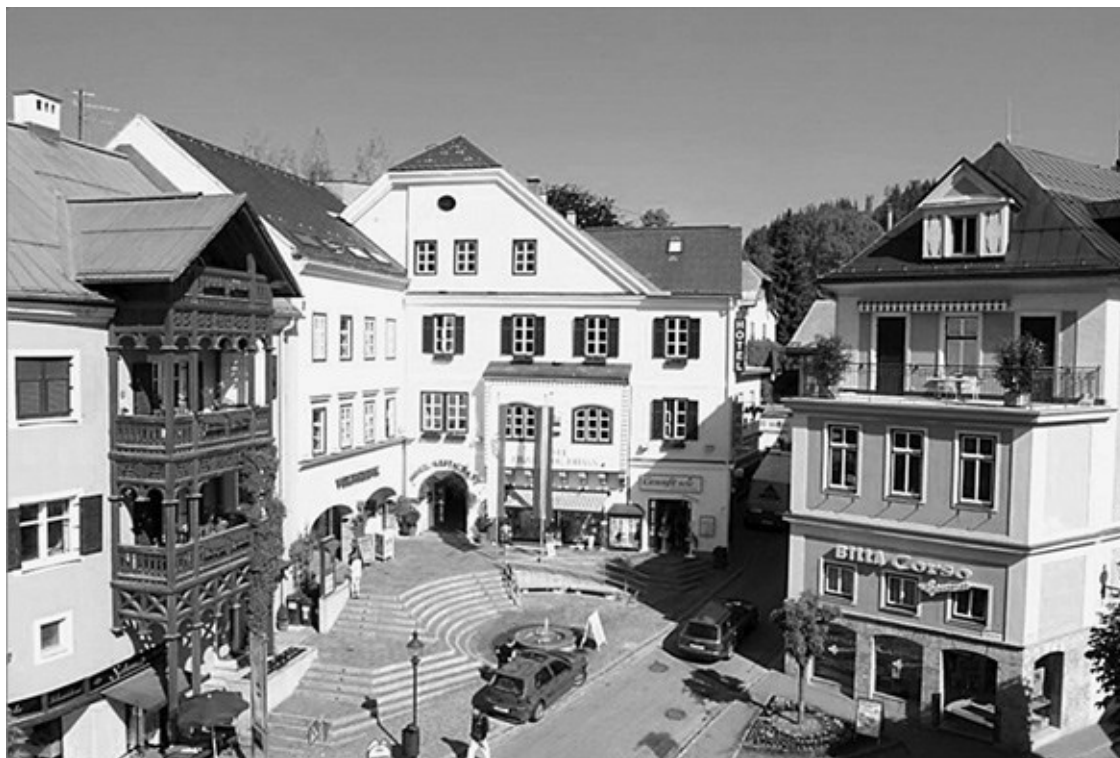
Городок Бад-Аусзее в Альпах: здесь теряются следы золота рейха

В 1974 году я лично достал его на глубине 70 метров со дна Грюнзее. Номер В425: та самая серия была на поезде № 277, исчезнувшем после выезда из Берлина.