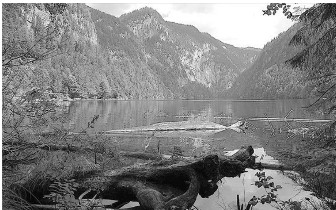
Озеро Топлиц – магнит кладоискателей со всего мира