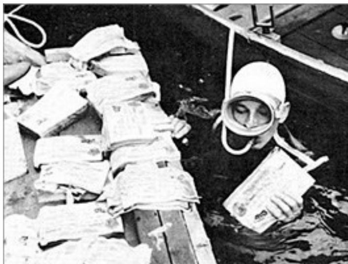
Аквалангисты достают со дна озера Топлиц пачки фальшивых купюр