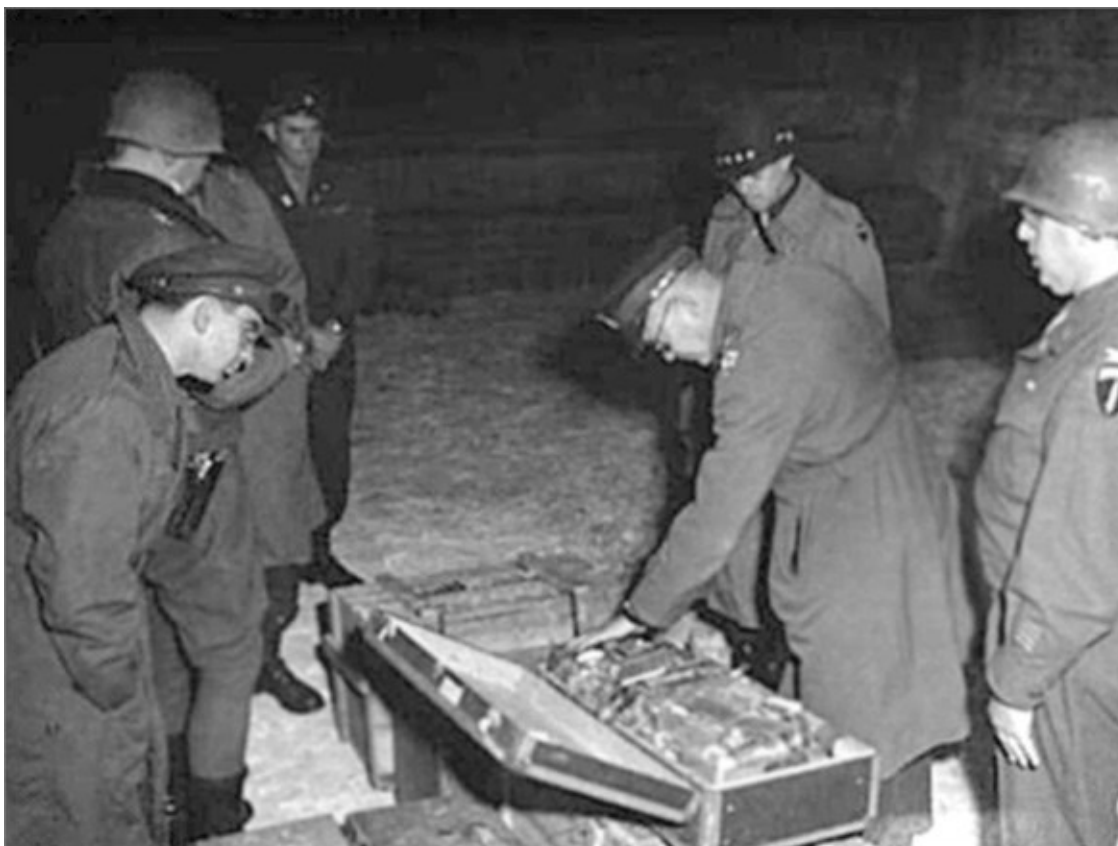
Американские военные проверяют содержимое поднятых со дна ящиков

Четыре года спустя австрийское министерство внутренних дел направило в район озера новую группу водолазов, и те подняли со дна еще несколько ящиков, в которых, согласно официальному сообщению, тоже находились фальшивые ассигнации, но каких-либо архивов с материалами и документами не было. Однако в том же 1963 году известный «охотник за нацистами» и руководитель центра по борьбе против антисемитизма Симон Визенталь направил письмо главе австрийского МВД, в котором выразил уверенность, «что в Топлицзее находятся документы, сообщающие о перемещении германских капиталов, включая так называемый список держателей вкладов». По словам Визенталья, эти капиталы предназначались для строительства «четвертого рейха».