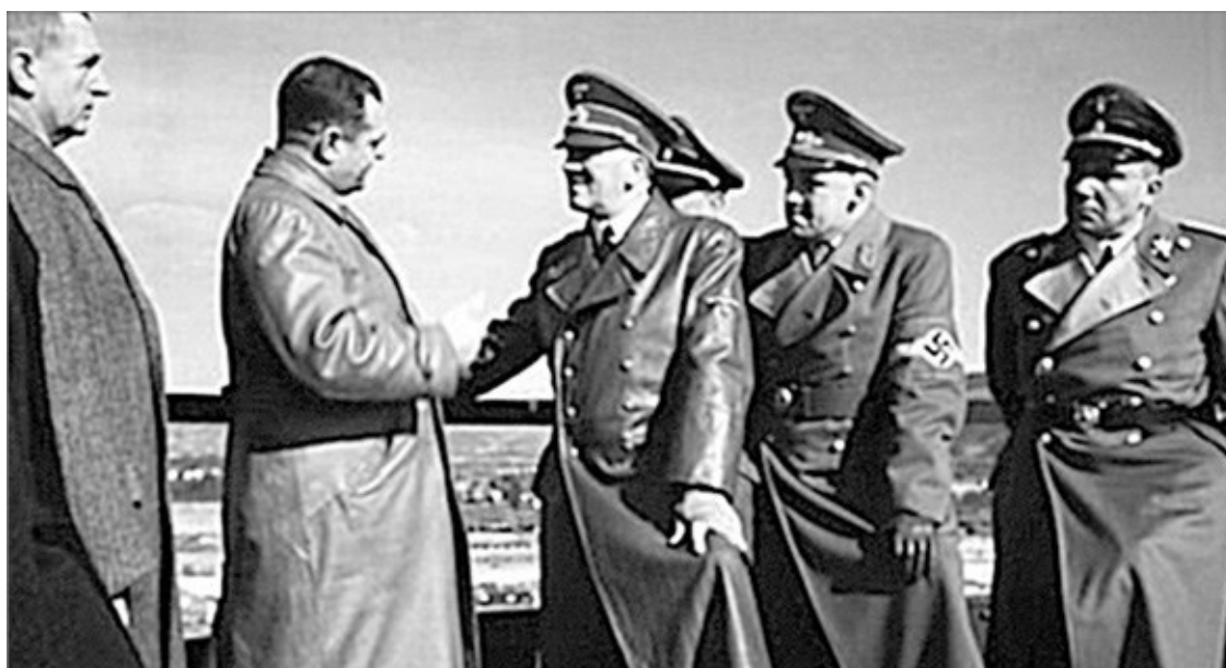
Фюрер поручал Борману самые ответственные и секретные задания