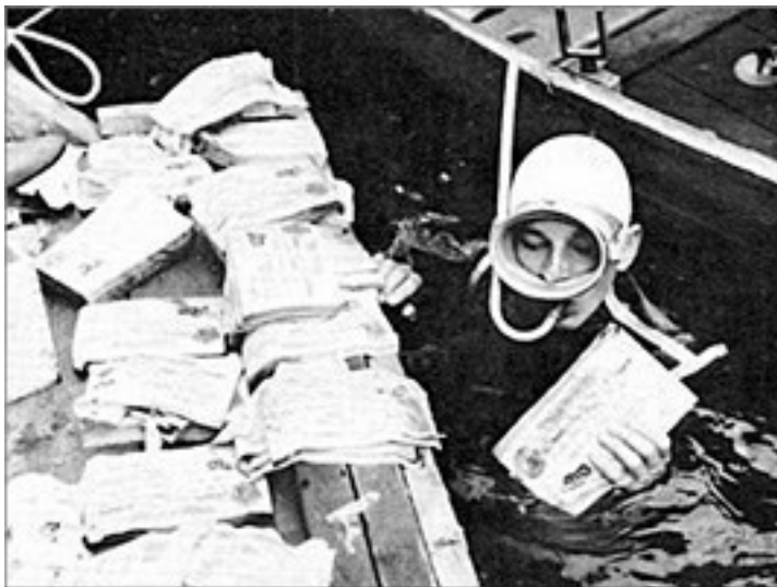
Аквалангисты достают со дна озера Топлиц пачки фаль-

рейха? По самым приблизительным подсчетам, на конец войны их размер мог составлять около 500 миллиардов золотых франков, из них половина – в виде вкладов в Германском банке, вторая половина – в виде драгоценностей, слитков драгоценных металлов, драгоценных камней и награбленных предметов культа и роскоши и, наконец, значительного количества произведений искусства. Часть спрятанных гитлеровцами сокровищ не обнаружена до сих пор, но даже то сравнительно небольшое, что было найдено и возвращено после войны, позволяет представить их значимость.