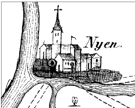
Ниен на карте начала XVII века

В 1642 г. Ниэн получил городской герб – лев, стоящий между двумя реками и держащий в правой лапе меч.