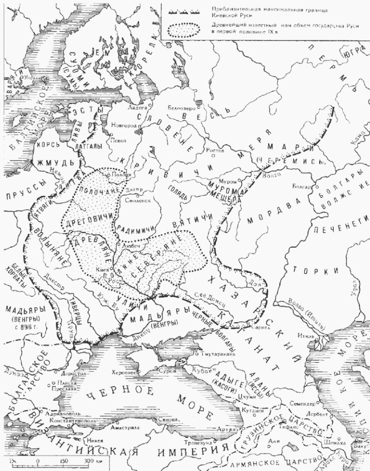
Киевская Русь в X–XII веках