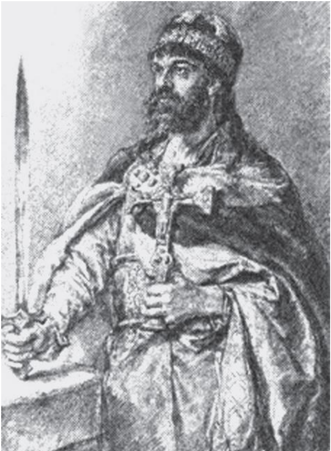
Князь Мешко (Мечеслав)

Около 966 г. Мешко женится на чешской княжне Доброве (Дубровке). Невеста была христианкой, и Мешко пришлось креститься. Вместе с Добровой в Польшу приехало и несколько священников-папистов во главе с епископом Иорданом. Именно с них и началось крещение Польши.