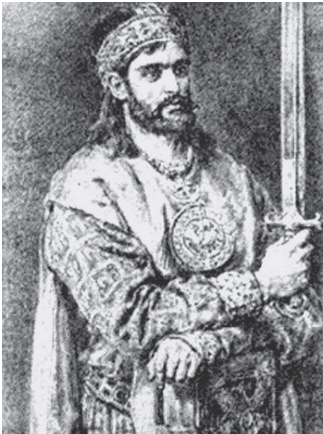
Казимир II Справедливый

Роман был не один, а с дружиной, и отправился вместе с детьми Казимира на Мечеслава Старого. Тот не желал биться с дружиной Романа Мстиславича и попросил его быть посредником в споре между ним и племянниками. Но Роман все же напал на войско Мешко. В результате дружина его была разбита, а сам князь, раненый, убежал в Краков, откуда уцелевшие дружинники перенесли его домой – во Владимир Волынский.