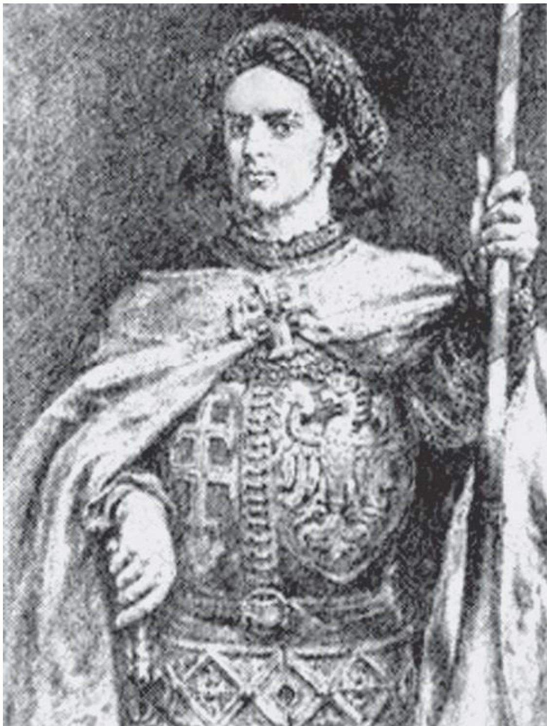
Владислав III Ласконогий

С.М. Соловьев писал о галицком князе: «Роман слыл грозным бичом окрестных варваров – половцев, литвы, ятвягов, добрым подвижником за Русскую землю, достойным наследником прадеда своего, Мономаха: «он стремился на поганых, как лев, – говорит народное поэтическое предание, – сердит был, как рысь, губил их, как крокодил, перелетал земли их, как орел, и храбр он был, как тур, ревновал деду своему, Мономаху». Мы видели, что одною из главных сторон деятельности князей наших было построение городов, население пустынных пространств: Роман заставлял побежденных литовцев расчищать леса под пашню, но тщетно