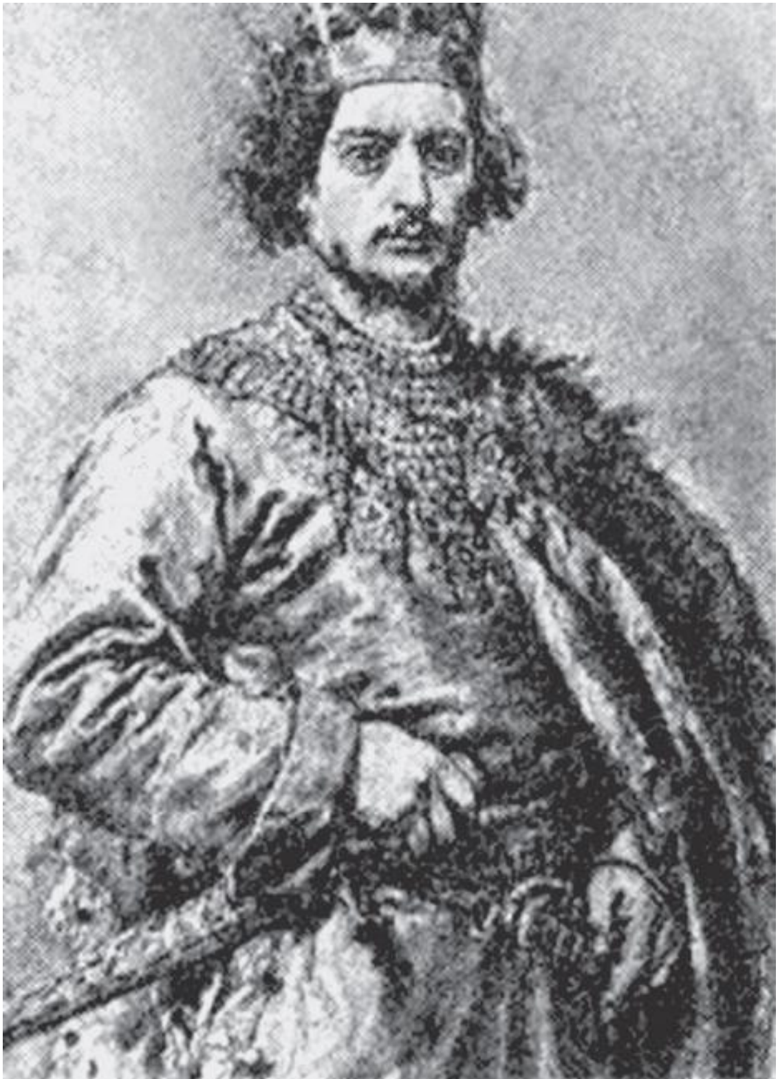
Болеслав I Храбрый

Примерно 6 в 1008–1009 гг. Болеслав I заключил мир с Владимиром Красное Солнышко. Мир был скреплен родственным союзом: дочь Болеслава вышла замуж за сына Владимира