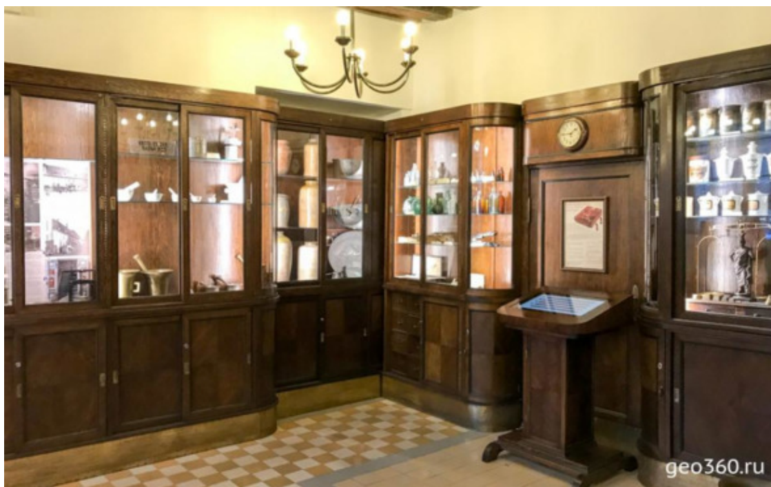
Музей в Ратушной аптеке