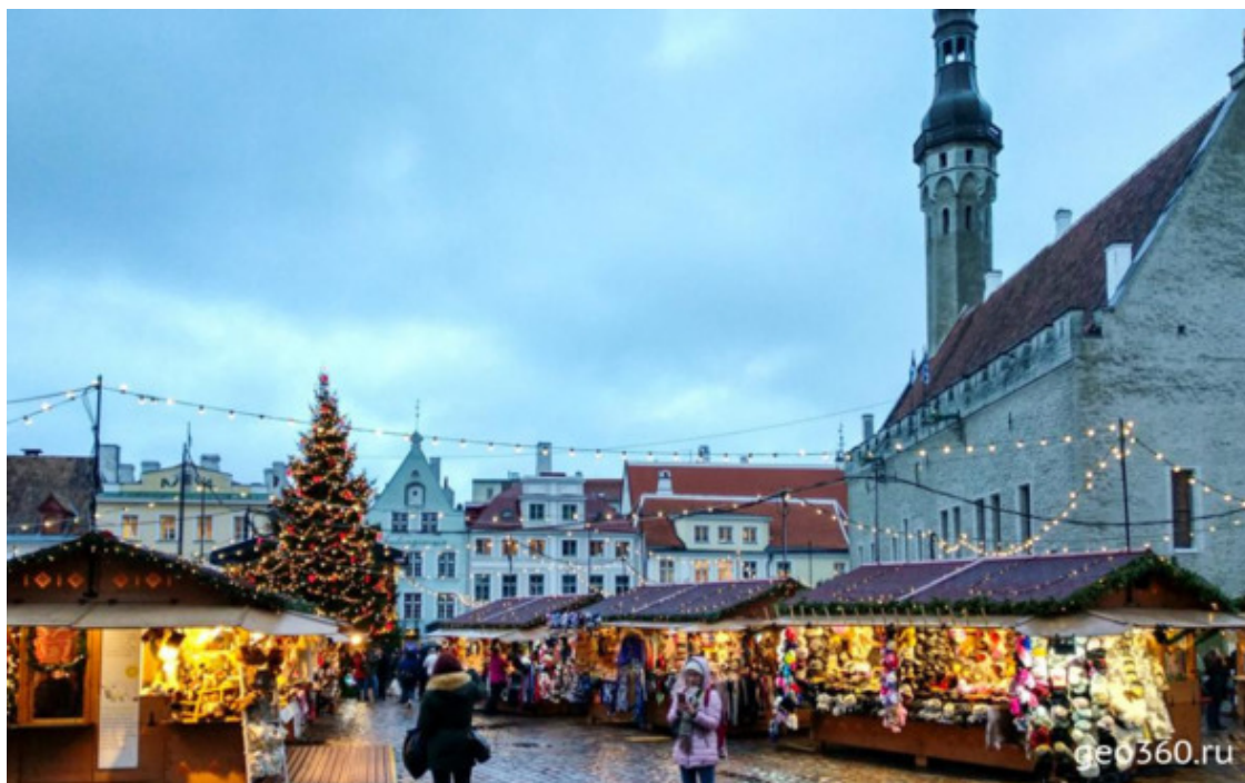
Рождественская ярмарка на Ратушной площади

Существует предание, что если, стоя на этом камне, загадать желание и сосчитать все шпили, то оно непременно сбудется.