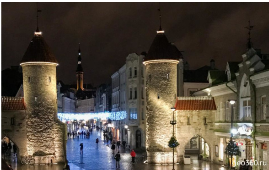
Вирусские ворота в Старый город

Рядом с городской ратушей, шпиль которой украшает символ Таллина, флюгер «Старый Томас», находится еще одна важная достопримечательность – Ратушная аптека, одна из старейших аптек Европы, которая работает по сей день.