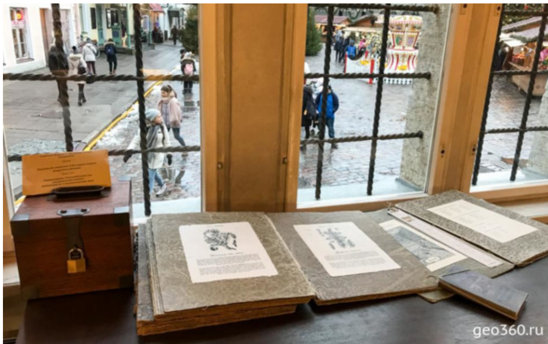
Музей в Ратушной аптеке

порох и факелы, а также игральные карты, различные ткани. Работала аптека и как своеобразное кафе. Тут можно было выпить чая или чего-нибудь покрепче.