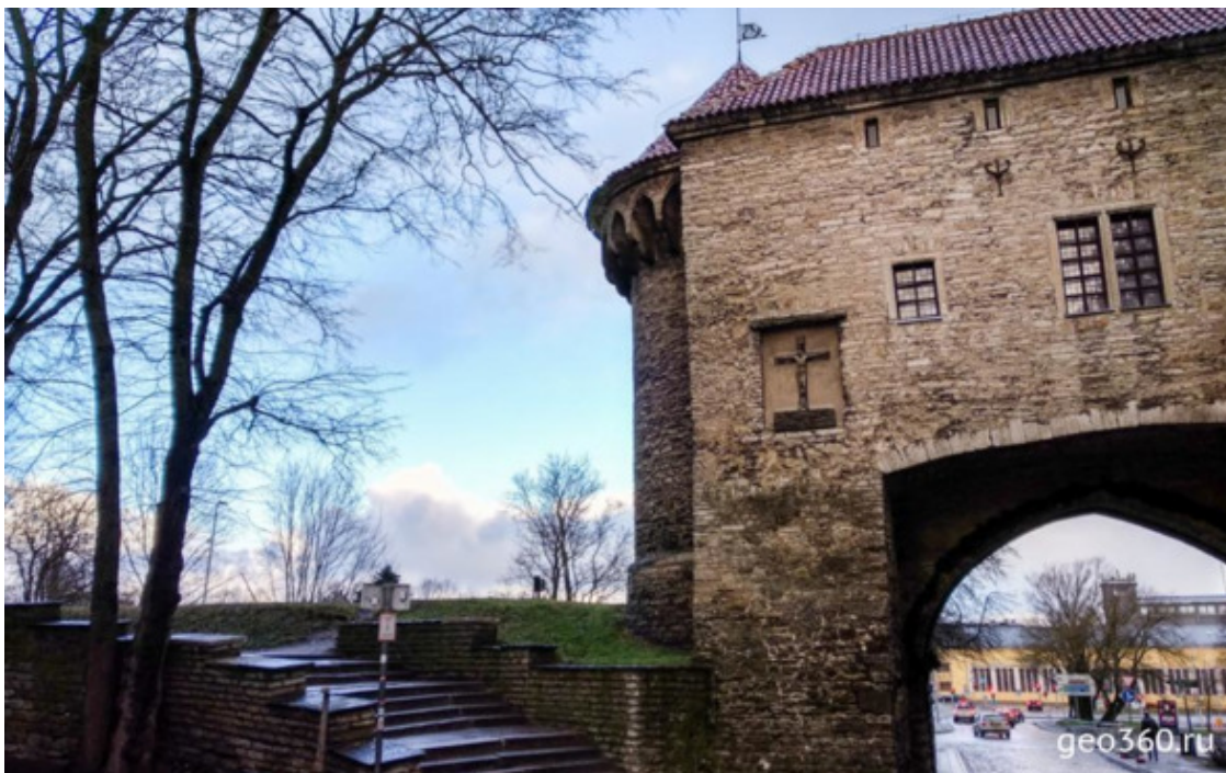
Большие Морские ворота в Старый город

Также на территории Старого города сохранилось много средневековых церквей. Некоторые из них (например, Церковь Олевисте) оборудованы смотровыми площадками, на которые можно подняться, чтобы с высоты посмотреть на Старый Таллин.