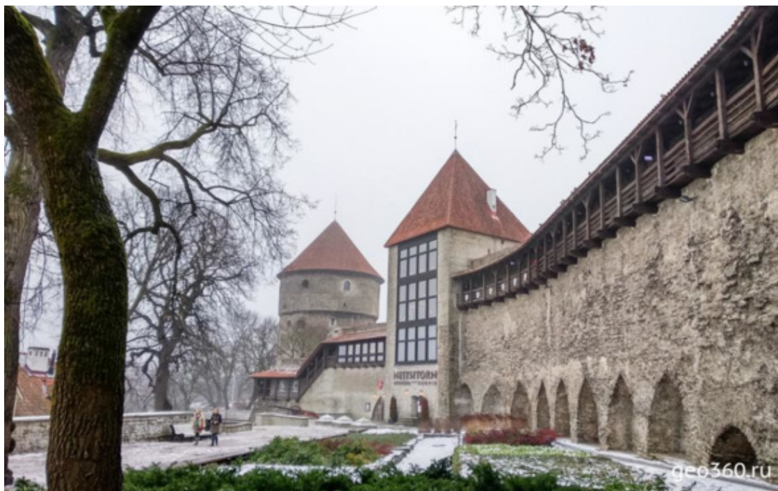
Сад датского короля

Ежегодно, 23 апреля, устраивается День открытых дверей, где можно познакомиться с работой парламента, архитектурой замка Тоомпеа и подняться на башню «Длинный Герман». Это, пожалуй, самая лучшая из всех смотровых площадок Таллина. Также на нее можно попасть в День государственного флага Эстонии – 4 июня.