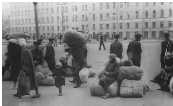
Беженцы у Московского вокзала

Но если те, кто добирался в родной город из зон отдыха, возвращались в свои дома, то иногородние селились где кто мог, зачастую прямо на улицах ленинградских пригородов, таких как Ульянка или Автово, в самодельных палатках, в которых летом было не холодно. Да и в газетах писали, что война скоро кончится. Тех, у кого в Ленинграде имелись родственники и знакомые, было совсем немного. Город буквально распухал от людей. Спасти беженцев можно было лишь одним способом – быстро переправить дальше. Возможностей для этого было не очень много, тем не менее до того, как замкнулось кольцо блокады, из города вывезли 147 тысяч иногородних.