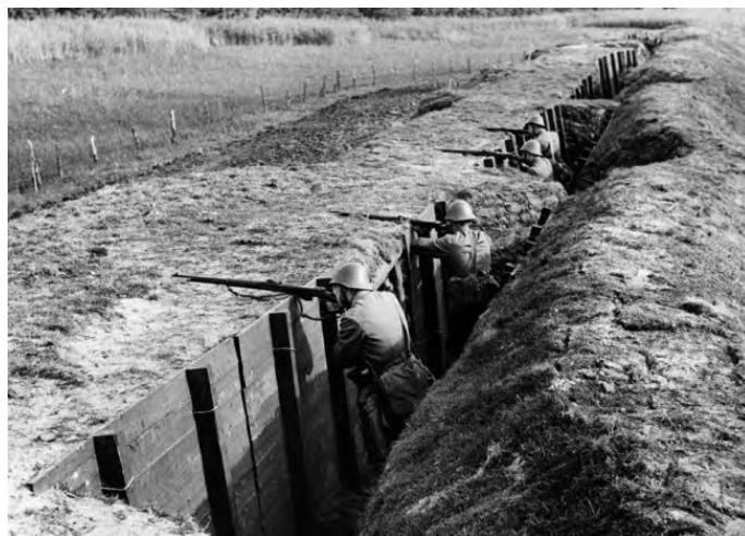
На учениях. 1939 г.

Тем не менее, например, в Псковской позиции в 1931 году уже было возведено 26 огневых точек. Несмотря на то, что доты имели в основном пулемётное вооружение, толщина стен многих превышала метр и была способна выдержать попадание 152-х миллиметрового снаряда.