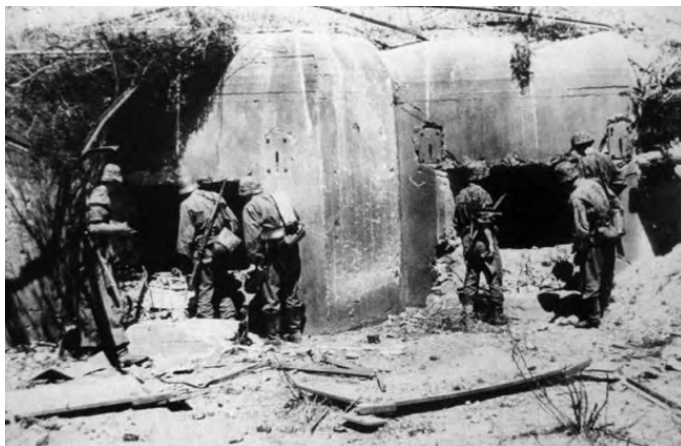
Гитлеровцы у поверженного дота

Через 9 дней немцев остановили на Лужском оборонительном рубеже. Три недели враг штурмовал укрепления, наспех возведённые ленинградскими женщинами и подростками, но так и не смог их преодолеть. Гитлеровцам пришлось сосредотачивать силы на других направлениях и организовывать фланговые удары со стороны Новгорода и Кингисеппа. А финские части и вовсе были остановлены в полосе обороны Карельского укрепрайона. Это был единственный укрепрайон линии Сталина, который не подвергся разоружению. Правда, несколько дотов врагу и здесь удалось захватить.