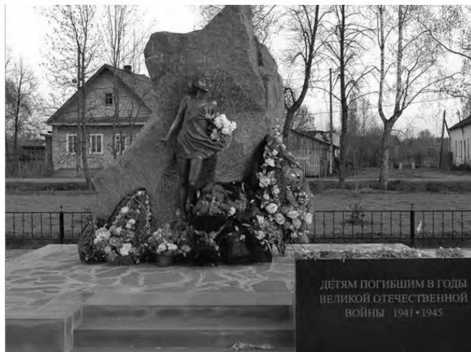
Памятник в Лычково

Ещё сложнее объяснить тот факт, что помимо Ярославской и Кировской областей детей стали вывозить и на территорию Ленинградской области, но не на восток, а на запад, навстречу немцам. Вряд ли город тогда чувствовал угрозу со стороны Финляндии. Её войска особой активности ещё не проявляли, да и во время Зимней войны детей никуда не эвакуировали.