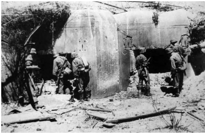
Гитлеровцы у поверженного дота

Через 9 дней немцев остановили на Лужском оборонительном рубеже. Три недели враг штурмовал укрепления, наспех возведённые ленинградскими женщинами и подростками, но так и не смог их преодолеть. Гитлеровцам пришлось сосредотачивать силы на других направлениях и организовывать фланговые удары со стороны Новгорода и Кингисеппа. А финские части и вовсе были остановлены в полосе обороны Карельского укрепрайона. Это был единственный укрепрайон линии Сталина, который не подвергся разоружению. Правда, несколько дотов врагу и здесь удалось захватить.