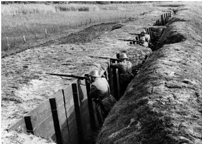
На учениях. 1939 г.

Тем не менее, например, в Псковской позиции в 1931 году уже было возведено 26 огневых точек. Несмотря на то, что доты имели в основном пулемётное вооружение, толщина стен многих превышала метр и была способна выдержать попадание 152-х миллиметрового снаряда.