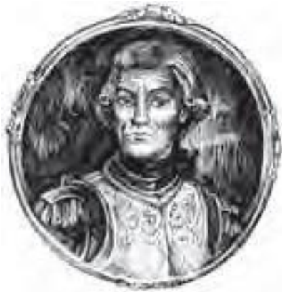
Мориц Август Бенёвский 1746–1786